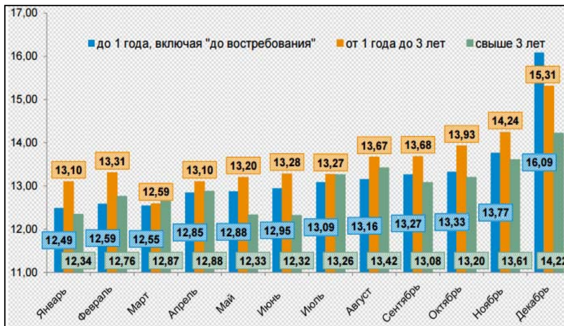
Рис. 2. Динамика ставок на рынке кредитования малого и среднего бизнеса в 2014 г.

Структура выданных кредитов продолжила смещаться в сторону уменьшения срочности кредитования - так, на срок до 1 года на рынке было выдано 70,2% кредитов, на долю кредитов сроком от 1 года до 3 лет приходилось 18,7%, а на долю долгосрочного кредитования - лишь 11,1%.