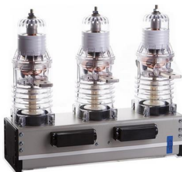
Рис.2 Выключатель ВВ-TEL

Подключение генераторных установок к шинам обеспечивается посредством вакуумных выключателей ячеек ввода генераторного напряжения распределительного устройства. В КРУ D-12P устанавливаются вакуумные выключатели ВВ/TEL. После расчета токов продолжительного режима и токов трехфазного короткого замыкания выбраны выключатели ВВ/TEL-10-12,5/630-У2. Внешний вид выключателя представлен на рисунке 2.