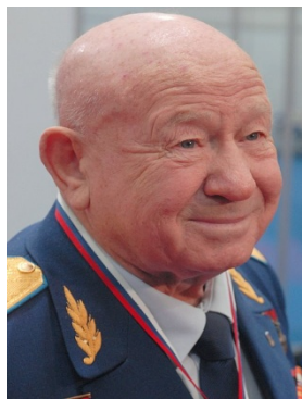
Рис. 4. Леонов А.А. на праздновании своего 80-летия в 2014 г.

Рассказывать об этом весело. Но Леонову, конечно, пришлось нелегко... Его полет и так был трудным, да к тому же сопровождался непредвиденными обстоятельствами – от начала до конца. И он всё это выдержал!