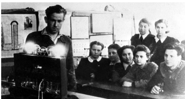
Рис. 1. Алексей Леонов в Чугуевском военном авиационном училище летчиков

50 лет – срок немалый, когда речь заходит о технике, прогрессе, науке. И уж тем более о человеческой жизни. Именно столько лет исполнилось 18 марта 2015 года со дня одного из важнейших событий в истории мировой космонавтики и нашей страны. 18 марта 1965 года космонавт Алексей Леонов стал первым человеком, вышедшим в открытый космос.