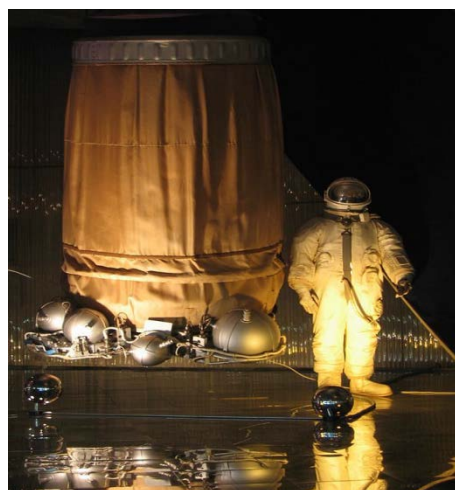
Рис. 3. Шлюзовая камера «Восхода-2» и скафандр «Беркут»

На рисунке 3 изображен гофрированный цилиндр представляющий собой надувную шлюзовую камеру. Можете представить сами, насколько тесно было как в шлюзе (внутренний диаметр в надутом состоянии – 1