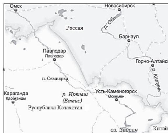
Рис. 1. Река Иртыш (Ертыс) в пределах Республики Казахстан

Note. F is the catchment area; L_1 is the the distance from the river mouth; L_2 is the the distance from the river source; H is the average height of a watershed; Q_{cp} is the long-term mean water discharge over the period of observations; \varepsilon_Q is the relative standard error of the sample mean water discharge for the entire period of observations; C_v is the coefficient of variation of annual runoff; \varepsilon_{C_v} is the relative standard error of the coefficient of variation of annual runoff; N is the number of observations.