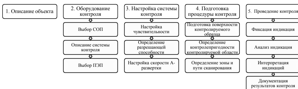
Рисунок 1 – Унифицированная методика контроля объектов АЭ

Как видно на рисунке 1, методика предполагает выполнение нескольких этапов. При процедуре УЗК наиболее важными являются этапы «Оборудование контроля» и «Настройка системы контроля», поскольку от качества их выполнения зависят полученные результаты. На первом этапе происходит выбор стандартного образца предприятия (СОП), который должен быть изготовлен из аналогичного по акустическим свойствам материала и иметь соответствующие размеры относительно объекта контроля. Также важным на первом этапе является выбор пьезоэлектрического преобразователя (ПЭП) в зависимости от свойств контролируемого объекта.