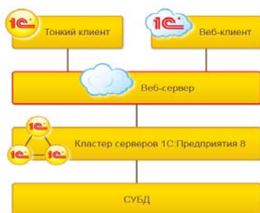
Рис. 2. Клиент-серверный вариант работы

Для взаимодействия с веб-сервером тонкий клиент использует протоколы HTTP или HTTPS. В свою очередь, веб-сервер взаимодействует с системой «1С: Предприятие» используя файловый или клиент-серверный вариант работы (рис. 2).