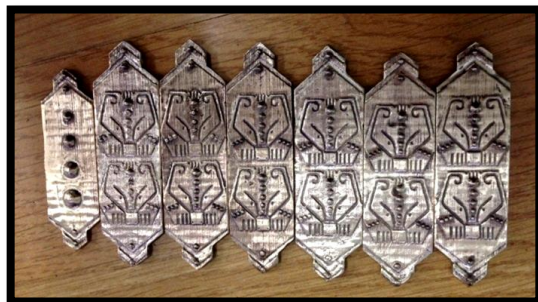
Рис. 6 Готовые отливки, вид спереди

Далее мы приступили непосредственно к производственному процессу. Процесс литья по выплавляемым моделям - длительный. Для начала мы изготовили модель из орг. стекла, затем с помощью нее сделали резиновую форму для изготовления восковок, ну а после уже заформовали восковые модели формовочной смесью на основе кристобалита и сделали отливки и механически обработали их (Рис. 6, Рис. 7)