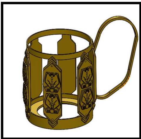
Рис. 4 3D сборка в программе SolidWorks

Далее в программе SolidWorks был спроектирован сам объект (Рис. 4, Рис. 5).