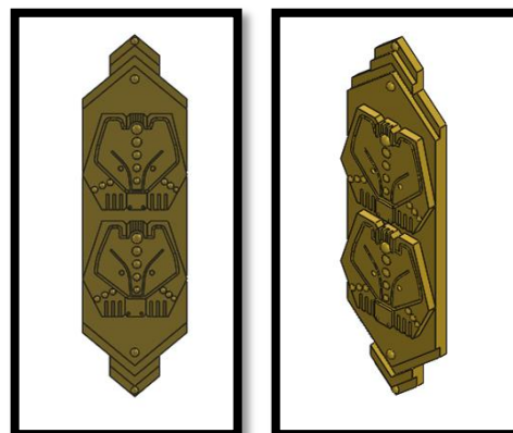
Рис. 2 3D модель отливки, созданная в программе SolidWorks

В программе SolidWorks была создана 3D модель будущей отливки.