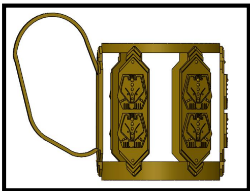
Рис. 5 3D сборка в программе SolidWorks

Далее мы приступили непосредственно к производственному процессу. Процесс литья по выплавляемым моделям - длительный. Для начала мы изготовили модель из орг. стекла, затем с помощью нее сделали резиновую форму для изготовления восковок, ну а после уже заформовали восковые модели формовочной смесью на основе кристобалита и сделали отливки и механически обработали их (Рис. 6, Рис. 7)