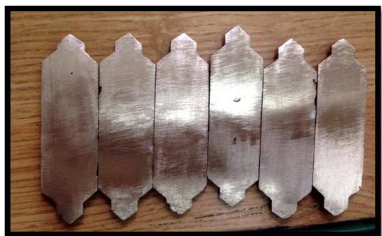
Рис. 7 Готовые отливки, вид сзади

Далее на токарном станке были выточены верхнее кольцо и нижнее кольцо с выступом для стакана.