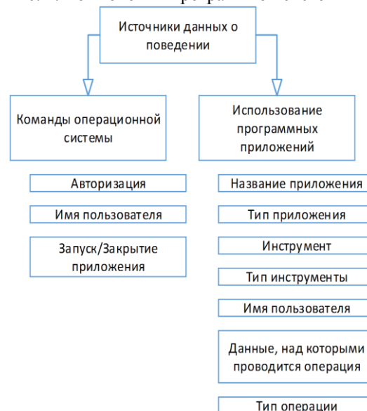
Рис. 2. Источники данных о поведении пользователей