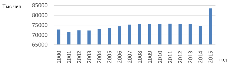
Рис. 1. Численность экономически активного населения в период с 2000 по 2013 годы

На рисунке 1 видны колебания численности экономически активного населения, но, несмотря на колебания, наблюдается процесс роста данного показателя. Аналогичная ситуация просматривается и в регионах России.