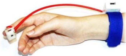
Рис. 1. Внешний вид устройства TouchSide

Первое устройство – TouchSide, представляет собой компактный манипулятор, который надевается на палец и управляется за счет движения его по поверхности (рисунок 1).