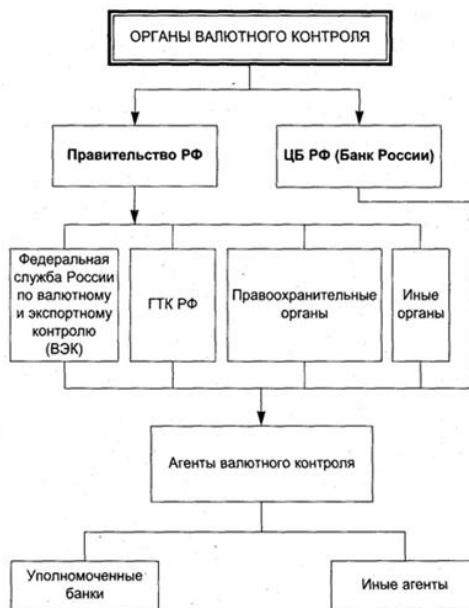
Рис. 1. Органы валютного контроля

Валютное регулирование в стране является неотъемлемой частью денежно-кредитной политики государства и обеспечивает безопасность в сфере валютных отношений. Выделяется четыре модели валютного регулирования. Для того, что бы оценить важность и влияние валютного регулирования для экономики страны необходимо рассмотреть каждую модель на примере ее действия в условиях российской действительности. Развитие валютного регулирования в России прошло несколько этапов.