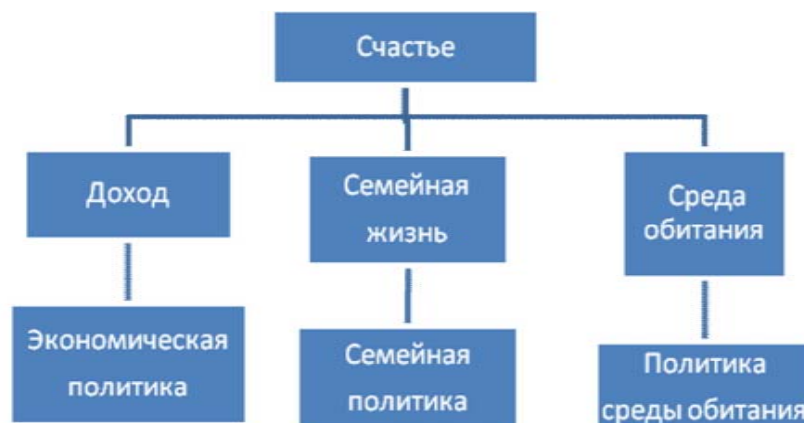
Рис. 1. Экономическая политика в идеальном мире (по R. Layard)

Традиционный подход к достижению счастья с помощью экономической политики может быть показан на рис. 1.