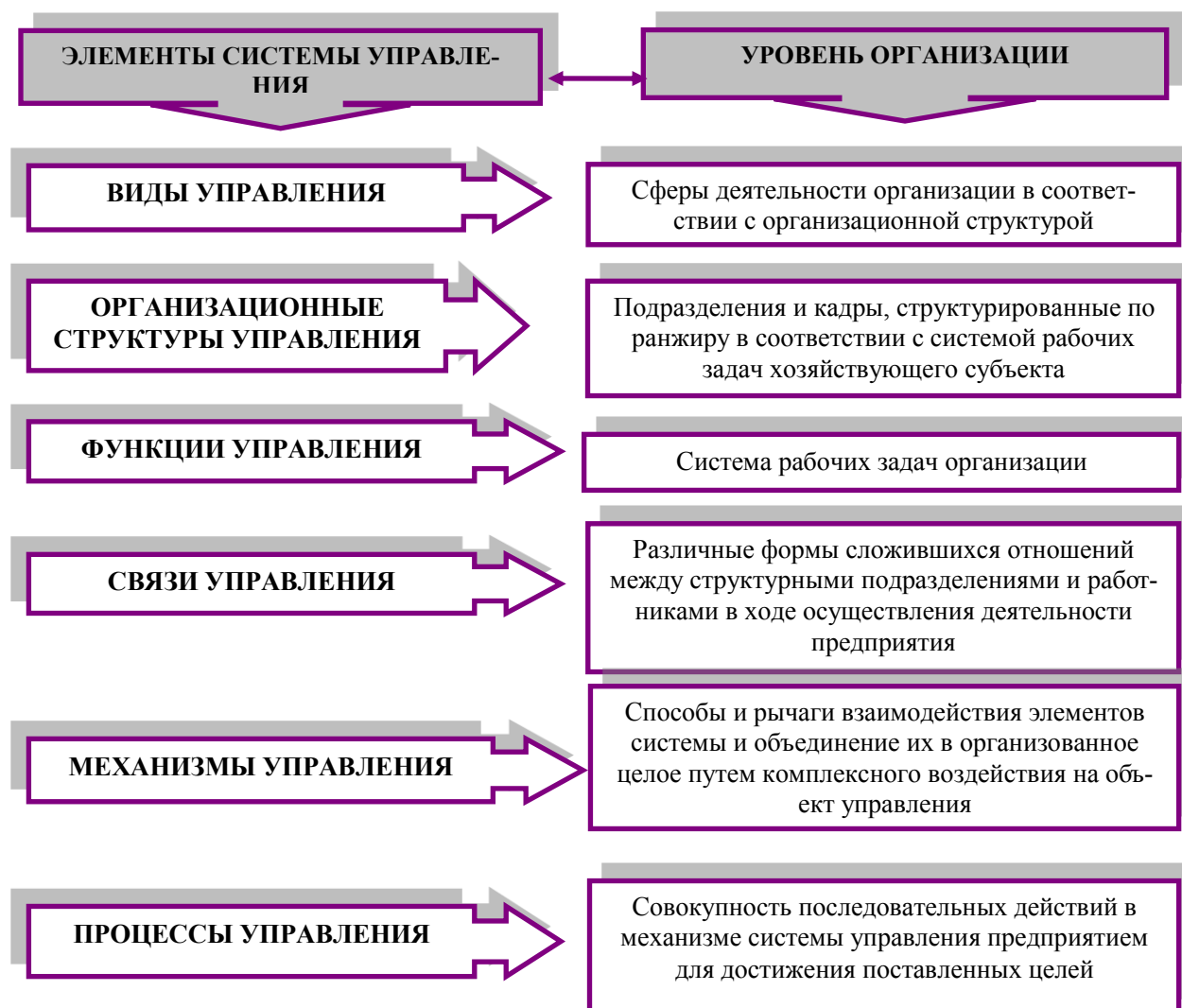
Рис. 2. Элементы системы управления в уровнях организации

В заключение еще раз подчеркнем, что современный менеджмент, отвечающий всем требованиям экономики знаний, обладающий свойствами системы, имеет целый комплекс сложных подсистем управления, свои входы и выходы в виде ресурсного обеспечения и обратной связи, которые составляют элементную базу современного менеджмента (рис. 2).