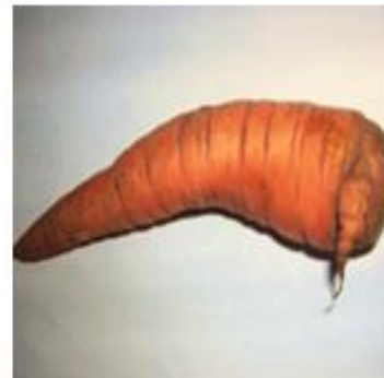
Рисунок 6 – Прорастание в моркови

Наше исследование позволяет предполагать, что различные мутации и изменения человеческого тела и растений, это эпитаксиальные процессы, которые являются не аномалиями, а заложенными природой закономерностями и зависят от наличия в окружающей среде геопатогенных зон. Эпитаксию животных и растений можно рекомендовать как один из способов биоиндикации окружающей среды.