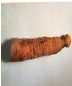
Рисунок 4 – Скиптровидный нарост на моркови

Впервые нами проведены эксперименты по изменению условий хранения корнеплодов (картофель, морковь, чеснок). В экстремальных условиях в них наблюдается эпитаксия (рис. 4, рис. 6). Двойникование срастание и прорастание встречается также у животных и людей. При рождении людей могут возникнуть различные аномалии, от двойникования (сиамских близнецов) до параллельного срастания, различных прорастаний (рис. 5).