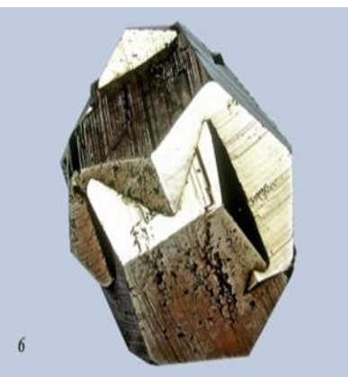
Рисунок 3 – Двойник пирита (7,5x7,5x5 см). Рио-Марина о. Эльба, Италия.

Впервые нами проведены эксперименты по изменению условий хранения корнеплодов (картофель, морковь, чеснок). В экстремальных условиях в них наблюдается эпитаксия (рис. 4, рис. 6). Двойникование срастание и прорастание встречается также у животных и людей. При рождении людей могут возникнуть различные аномалии, от двойникования (сиамских близнецов) до параллельного срастания, различных прорастаний (рис. 5).