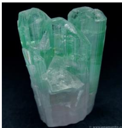
Рисунок 2 – Параллельное срастание кристаллов турмалина. ( http://geo.web.ru/druza/a-Dvor_mus_Sorb.htm )