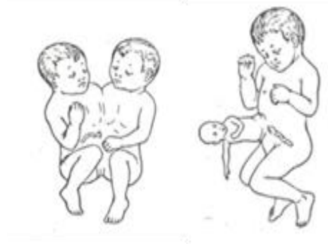
Рисунок 5 – Срастание и прорастание в человеке (уродства)