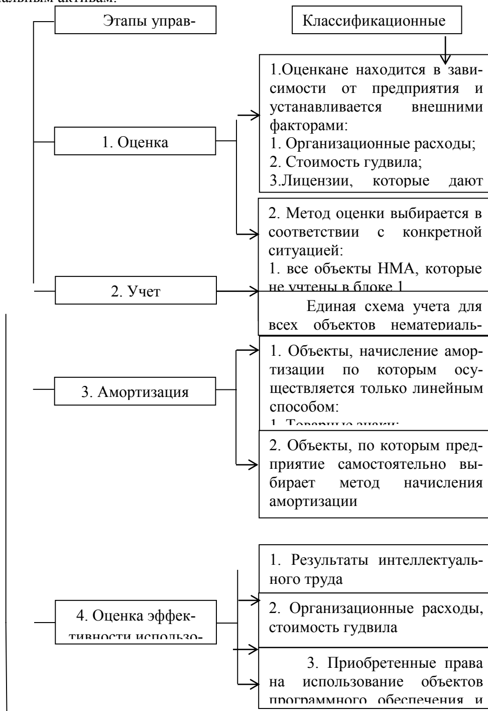
Рис. 2. Классификация объектов нематериальных активов по принципу наличия возможности выбора вариантов выполнения управленческих решений