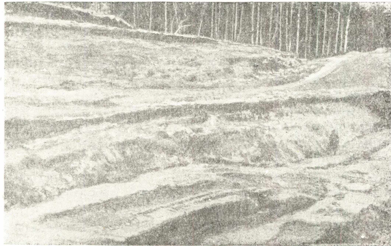
Рис. 1. Общий вид опытного карьера № 2 Туганского месторождения.

Поле № 3 (мерзлотометр 10) располагается в 20 м от полей № 1 и № 2 и характеризуется естественным снежным покровом.