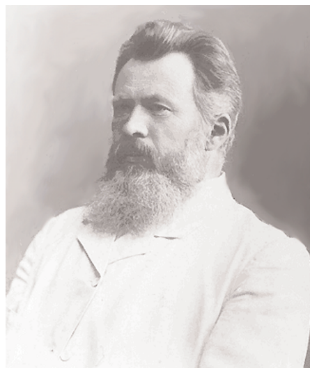
Профессор В.А. Обручев, редактор журнала в 1910 — первой четв. 1912 гг.