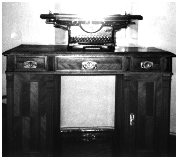
Рис. 4. Столик и пишущая машинка В.А. Обручева в Иркутском областном краеведческом музее