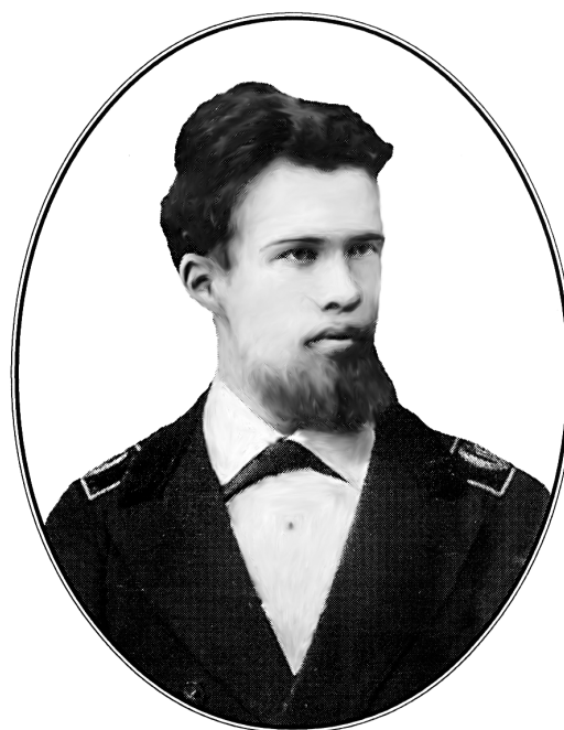
Рис. 1. В.А. Обручев – в студенческие годы (из фондов музея В.А. Обручева)

Обручева, хранящейся в кабинете-музее, стоит рассказать подробно.