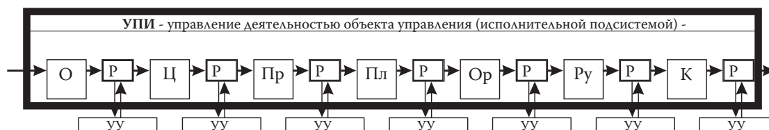
Рис. 2. Фрактальная структура управления (укрупненная)

Обозначения: О – ориентация (проблематизация); Ц – целеполагание; Пр – прогнозирование; Пл – планирование; Ор – организация; Ру – руководство; К – контроль; Р – решение (принятие решения, сообщение решения, приказ и т.п.); УУ – управление управлением (управление собственной управленческой деятельностью субъекта управления).