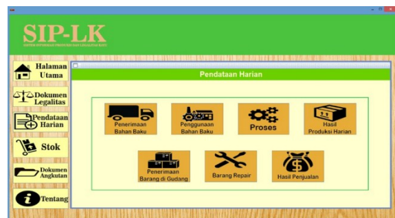
Gambar 2. Tampilan SIP-LK

Halaman muka SIP-LK terlihat pada Gambar.2