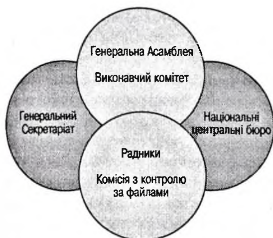
Рис. 1. Структура Інтерполу

ля, Виконавчий комітет; Генеральний Секретаріат; НЦБ, а також Радники та Комісія контролю за файлами [2].