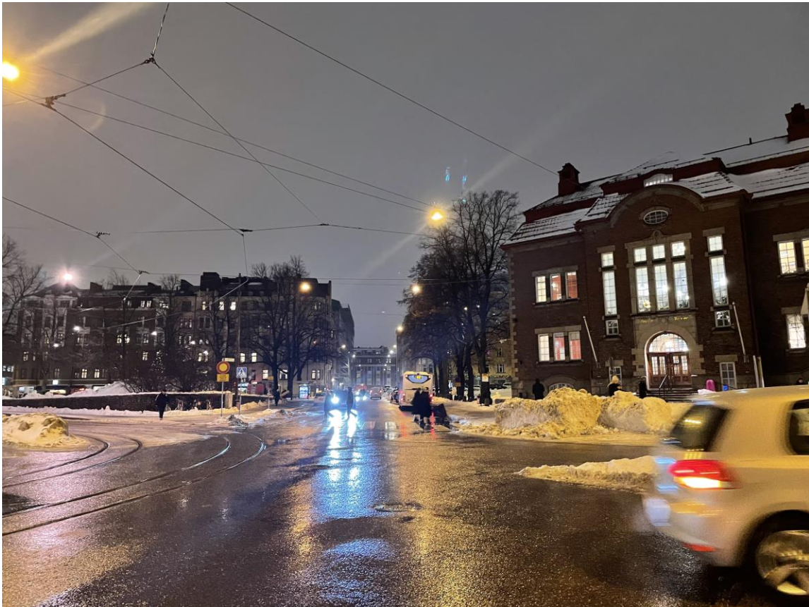
Kuva 5. Fleminginkadun ja Viidennen Linjan risteys. Vasemmalla Karhupuisto, oikealla Kallion kirjasto.

”Se on jäänyt mieleen, että silloin kun ensimmäisiä kertoja istui Fleminginkadun asunnossa niillä erkkeri-ikkunalaudoilla ja katsoi Karhupuistoon ja sitä ihmisvilinää, niin se oli sellanen... Siihen liittyy se tausta, että tulin pieneltä paikkakunnalta ja oli sitten yhtäkkiä keskellä kaupunkia. Jotain sellasta vapaudentunnetta siinä oli. Tässä kun välillä on asunut muualla ja ollut täällä serkkuni luona yötä Kaarlenkujalla ja siellä kuuntelin sitä ratikoiden kirskuntaa ja silloin tuli se muistikuva tosta Flemarilta, että olispa joskus kiva olla vielä täällä. Että asuu yläkerrassa ja se kaupunki on niin lähellä siinä ja ihmiset ja kaupungin äänet on siinä lähellä.” - H5