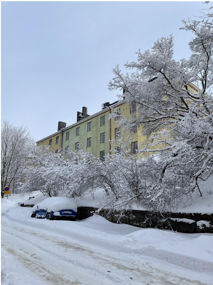
Kuva 7. Franzeninkatu, Torckelinmäki.

”Yksi mikä mua on auttanut tässä paikalleni asettumisessa on, että olen käynyt näillä opastetuilla Kallion kävelykierroksilla. Kallion naiset, Katri Valan puisto ja on ollut puistoteemoja... Olen aika monta kierrosta kuunnellut ja musta ne on tosi mielenkiintoisia ja ne auttaa siinä asettumisessa. Oman paikallishistorian tunteminen on tosi tärkeää ja se on myöskin tosi mielenkiintoista.” - H5