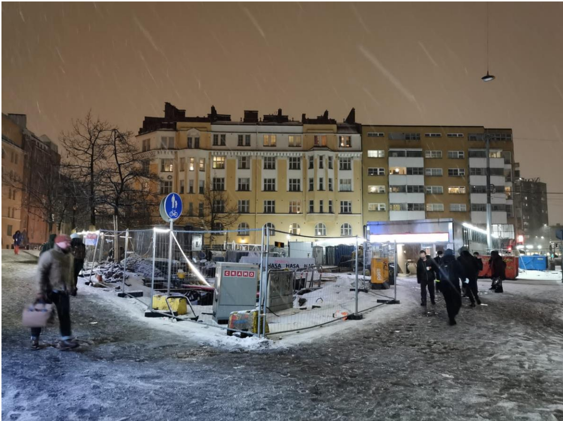
Kuva 3. Sörnäisten metroaseman lähiseutu, Vaasanpuistikko eli Piritorin oli remontissa helmikuussa 2022. (H2)

Se sellanen perus spurguporukka vähenee tai ainakin keskittyy tietyille katupätkille. Tän kaupunginosan luonteesta en tiennyt ja mä luulen, että 20 vuotta on vaikuttanut täällä aika paljon siihen, että minkälainen se on ollut. Et muutos on ollut tosi tosi nopeeta, jos miettii et esim. silloin on ollut, ihan joka ikisessä korttelissa, parhaassa tapauksessa kaks, näitä thaihierontapaikkoja ja sitten oli tälläsiä perusräkölöitä. Et en varmaan minä tai olisko kukaan muukaan pystynyt arvaamaan sitä, et miten nopeesti nää kulmat on siisteytyneet.” - H3