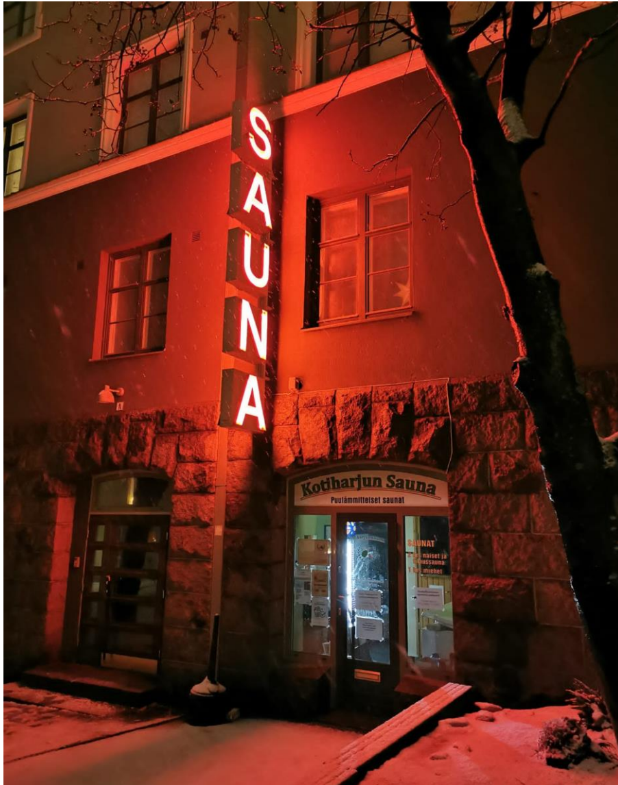
Kuva 4. Kotiharjun sauna betonipenkkeineen. (H1)

Alueelle rakennetuissa pienissä asunnoissa ei ollut kylpyhuoneita, joten yleisiä saunoja rakennettiin korvaamaan asuintalojen puutteita. Yleisten saunojen määrä lisääntyi väkiluvun kasvaessa. Saunoista muodostui osa yhteisöllistä kaupungissa elämistä ja kaupunkikulttuuria, jota se yhä tänäkin päivänä on. Seuraavassa sitaatissa haastateltava nostaa saunat esille esimerkkinä paikoista, joissa kohtaa oman kaupunginosan asukkaita ja kokee olevansa osa yhteisöä.