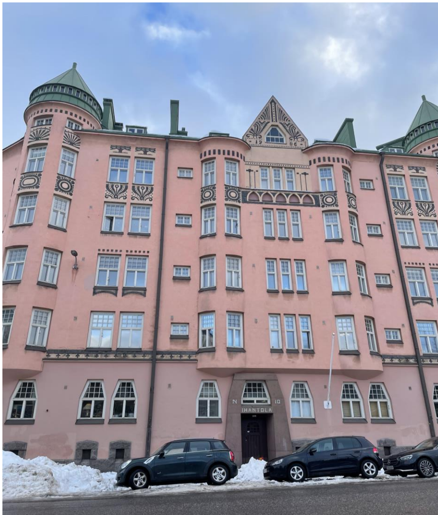
Kuva 2. Ihantola, jugendtalo Kallion Karhupuistossa.

umpikorttelit rakennettiin 1920-luvun lopulla. Vuosikymmenten edetessä puutaloja purettiin ja niitä myös tuhoutui sotavuosien aikaan. Alueelle rakennettiin yhä suurempia kivisiä asuinkerrostaloja. Suurin osa Linjojen puutalokortteleista purettiin 1950- ja 1960-luvuilla ja niiden paikalle rakennettiin kivisiä kerrostaloja. Vanhasta Kalliosta jäi jäljelle muutamia alkuperäisiä puu- ja kivitaloja, sekä alkuperäinen korttelirakenne. Kallion uudisrakentaminen tuli päätökseensä 1990-luvulla. (Helsingin kaupunkiympäristön toimiala 2018.) Vanhan rakennuskannan katoaminen vei mukanaan osan alueen historiaa, mutta toi mukanaan nykyään nähtävän kerroksellisen rakennetun kaupunkimaiseman.