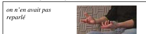
Figure 3 : Geste métaphorique produit sur « on n'en avait pas reparlé », qui permet d'apporter une modalité à l'énoncé mais pour lequel il est difficile de déterminer un affilié lexical précis.

En ce qui concerne les autres catégories de gestes, soit elles contiennent très peu d'occurrences comme le cas des emblèmes, soit il est impossible de déterminer un affilié lexical précis comme dans le cas de nombreux métaphoriques qui apportent une modalité à tout l'énoncé comme dans la Figure 3. La relation sémantique entre geste et parole est alors implicite, or, pour pouvoir effectuer une comparaison en termes de temporalité, il faut pouvoir se baser sur une relation sémantique explicite entre geste et parole. C'est pour cette raison que nous avons choisi pour cette étude de ne retenir que les gestes iconiques, choix qui était également celui de Chui [6], alors que Kida & Faraco [9] et Loehr [14] ont travaillé sur différentes catégories de geste.