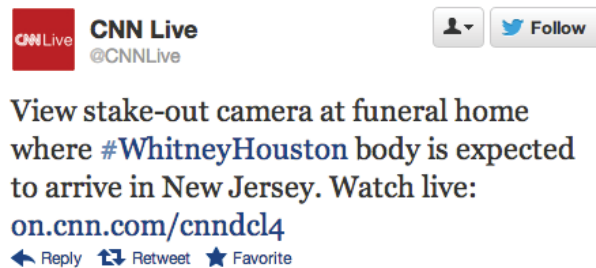
Figure 2. Exemple d'un Tweet issu de la collection INEX Tweet Contextualization pour l'année 2012.

La principale difficulté avec l'utilisation des hashtags vient du fait qu'ils sont pour la plupart composés de plusieurs mots concaténés. La figure 2 illustre ce problème avec le hashtag #WhitneyHouston. Dans ce cas précis, il ne serait pas possible pour un système de recherche d'information classique de renvoyer des documents liés à Whitney Houston étant donné que ces deux mots n'apparaissent pas dans le Tweet.