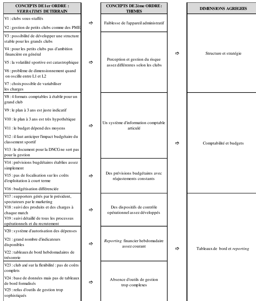
Schéma 2 : Structuration des verbatim recueillis