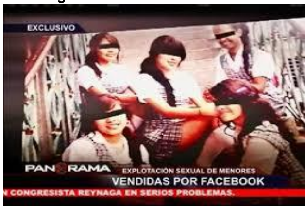
Imagen I. Prostitución de adolescentes