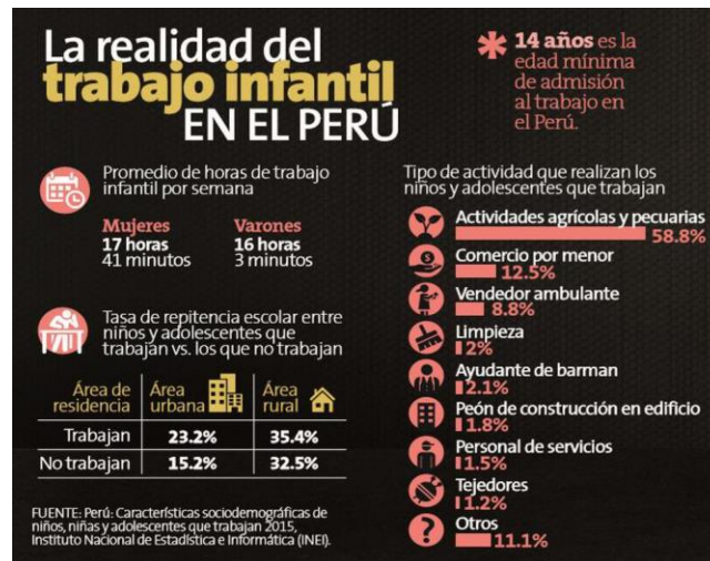
Imagen II. Información sobre el trabajo de niños, niñas y adolescentes

Como se aprecia en los casos descritos, es común denominador que exista un ambiente de descuido y desapego hacia los hijos; siendo los padres responsables de su resguardo, y, en casos excepcionales, algún familiar o persona designada termina desatendiendo al menor o peor aún lo expone a situaciones de violencia en cualquiera de sus modalidades, una de ellas el abuso mediante trabajo infantil.