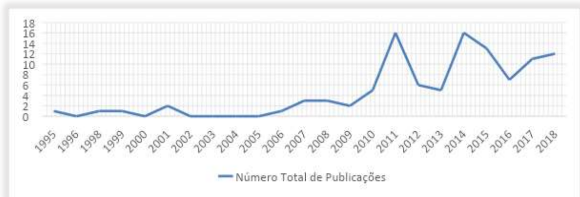
Figura 1: Gráfico da evolução das produções sobre a formação Estatística dos professores

O crescimento do número de publicações, desde então, pode ser observado na Figura 1, que mostra a linha de evolução das produções relacionadas ao tema em questão.