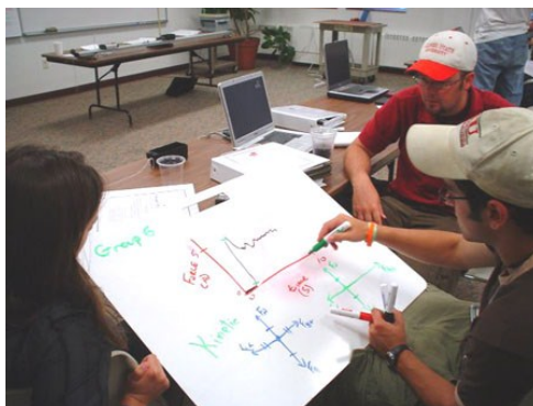
Figura 1. Estudantes norte-americanos durante a produção de um whiteboard.

O ponto culminante de um ciclo de modelagem é o relato e discussão dos resultados em sessões de whiteboarding . Hestenes (2010) reflete que é nesse momento que a aprendizagem dos estudantes ocorre mais profundamente porque tais sessões estimulam a avaliação e consolidação da experiência adquirida na atividade de modelagem. As sessões de whiteboarding tornaram-se uma característica singular da Instrução por Modelagem. Os whiteboards (Figura 01) são pequenos quadros brancos (medindo aproximadamente 80 cm x 60 cm), são dinâmicos e fáceis de implementar; são efetivos ao permitirem rico suporte nas interações de sala de aula.