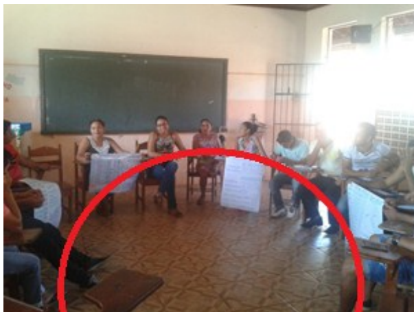
Figura 3. Classe organizada em forma de circunferência durante uma sessão de whiteboarding.

Para isso, a classe é organizada em formato de circunferência e cada equipe ocupa uma posição na mesma. O professor também ocupa um lugar na circunferência para poder gerir o discurso de modelagem. Desse modo, pode existir maior interação entre professor & estudantes e estudantes & estudantes.