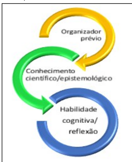
Figura 2: pressupostos teóricos de Ausubel (2003).

A atividade descrita no quadro 1, procura esclarecer a proposta do curso.