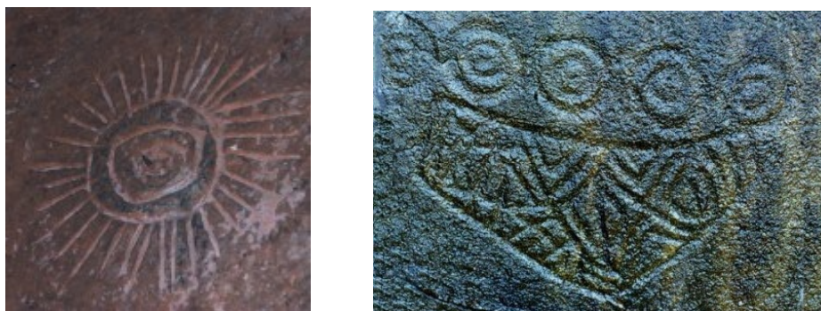
Figura 3: Representação dos conhecimentos prévios expressada pela maioria dos estudantes entrevistados: arte rupestre como primeiros ensaios para a história da geometria. (Adaptado de Mendiola, 2002).

No estudo realizado por Mendiola (2002), para 61,43% da amostra pesquisada existe a necessidade de considerar a arte rupestre como um dos primeiros movimentos para a história da geometria (figura 3).