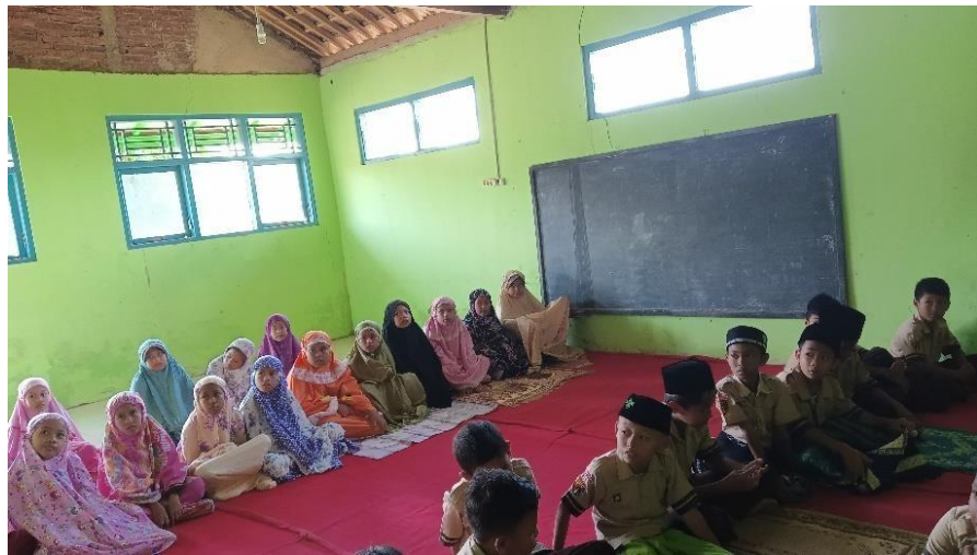
Gambar 6. Giat Keagamaan