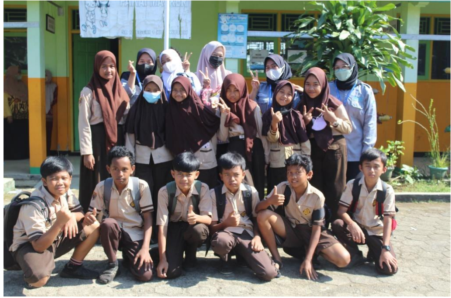
Gambar 7. Pelepasan dan Perpisahan Peserta Kampus Mengajar Angkatan 3 Tahun 2022