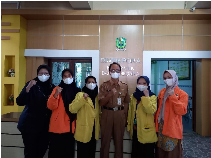
Gambar 1. Penerjunan dan Pembekalan Kampus Mengajar Angkatan 3 oleh Dinas, Pendidikan, Kepemudaan, dan Olahraga Kabupaten Banjarnegara