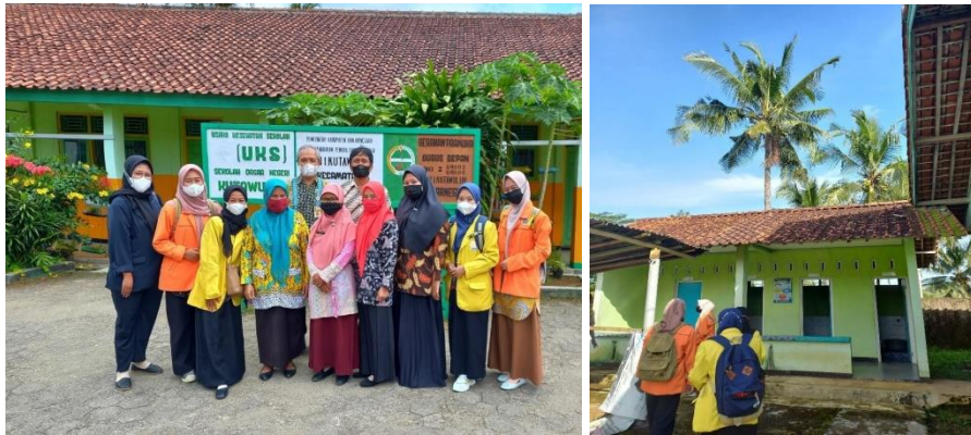
Gambar 2. Penyerahan dan Penerimaan Peserta Kampus Mengajar Angkatan 3 serta Observasi dan Koordinasi di SD Negeri 1 Kutawuluh