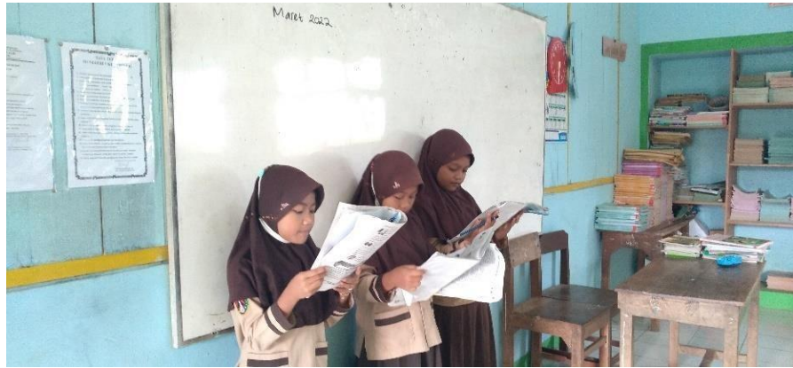
Gambar 3. Pembelajaran Literasi dan Numerasi