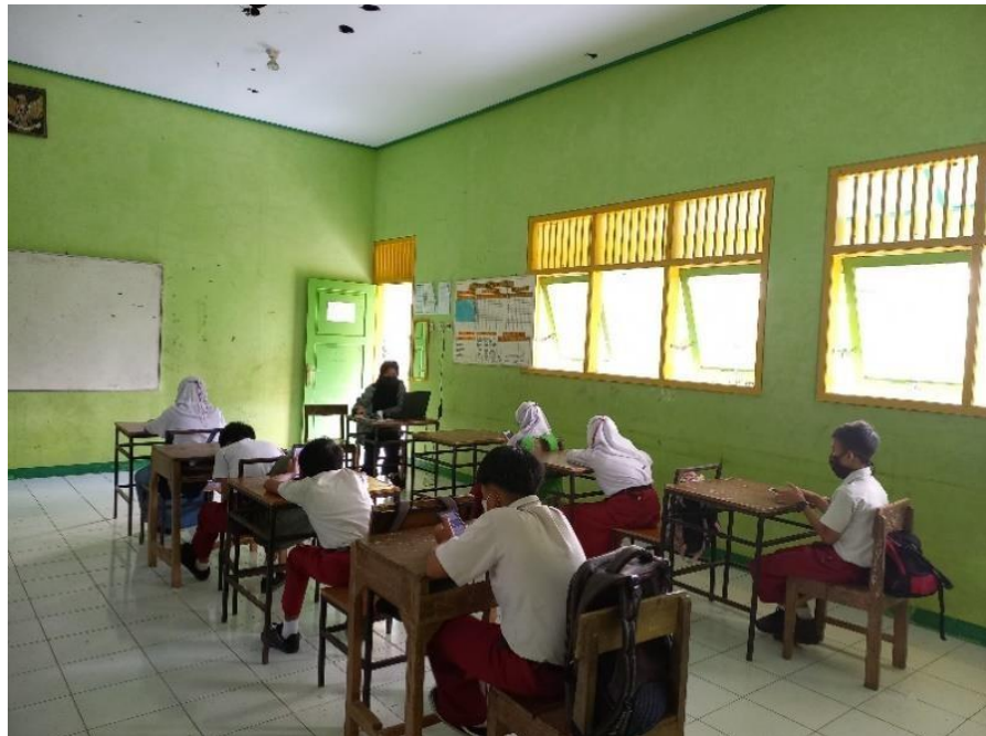
Gambar 4. Membantu Adaptasi Teknologi