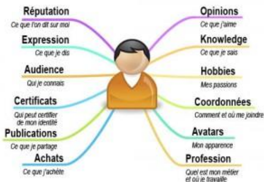
Image : l'écosystème de l'identité numérique, d'après un schéma original de Frédéric Cavazza

Notre identité est constituée de tout ce qui nous caractérise et nous différencie. Elle est un peu comme une boule disco, dont chacune des facettes refléterait un aspect de notre personnalité. Notre identité change avec le temps : elle évolue selon nos expériences, notre environnement, les gens que l'on rencontre, etc. Par ailleurs, tel que le mentionne Philippe Buschini dans un article sur son blogue : « Dans le monde numérique, il ne faut pas confondre « l'identité », qui est la représentation d'une personne dans un système d'information, avec « l'authentification », qui est un processus de vérification de cette identité ».