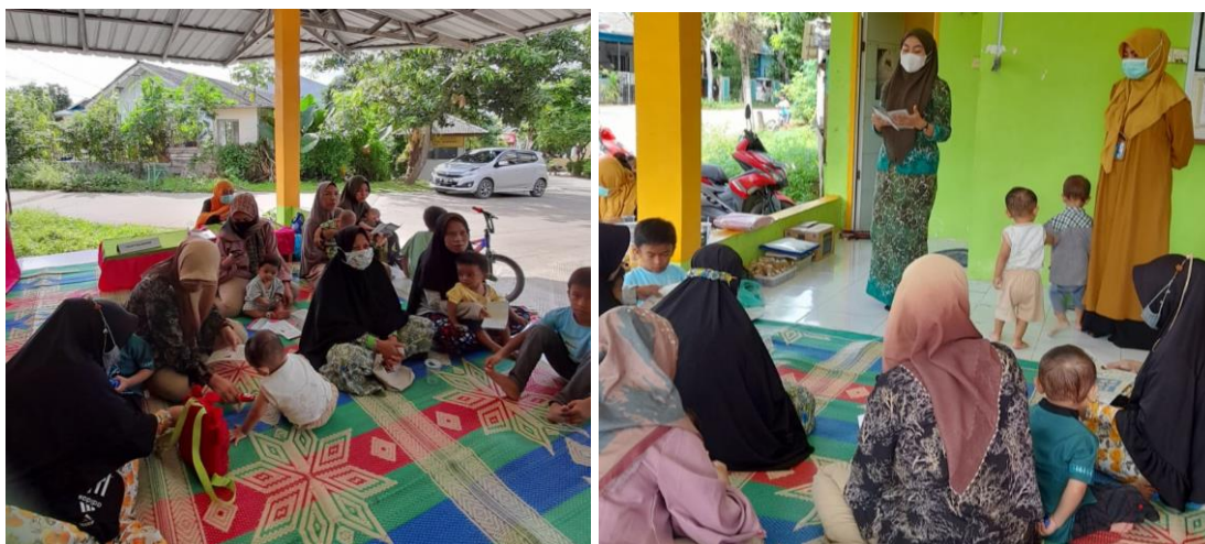
Gambar 1: Kegiatan saat Pelaksanaan Penyuluhan

Selama proses kegiatan yang dilakukan dalam pengabdian kepada masyarakat ini dapat mempengaruhi beberapa faktor antara lain; kondisi saat penyampaian materi yang kurang kondusif karena para ibu balita membawa balitanya aktif sehingga terkadang fokus ibu balita teralihkan dari materi yang disampaikan. Hal ini merupakan kendala dalam pelaksanaan pengabdian kepada masyarakat di pelayanan kesehatan wilayah setempat.