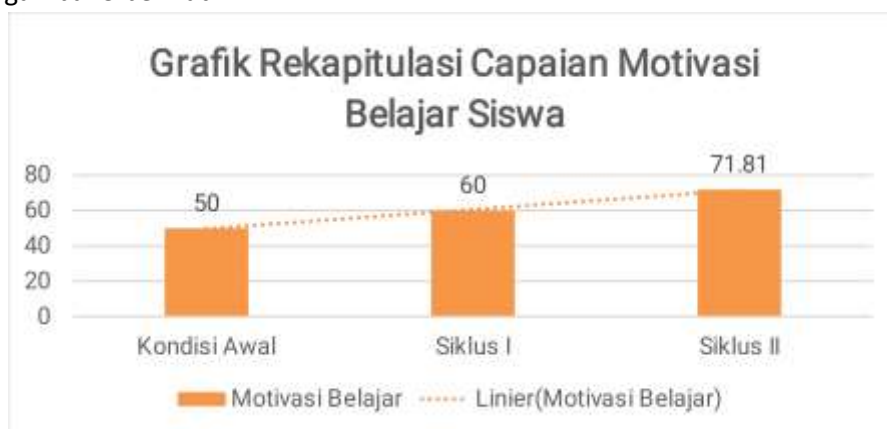
Gambar 2. Grafik Rekapitulasi Capaian Motivasi Belajar Siswa

Berdasarkan tabel 3 di atas, terbukti bahwa motivasi belajar yang menjadi objek penelitian mengalami peningkatan yang signifikan pada setiap siklus. Data kondisi awal motivasi belajar siswa adalah 50,00. Pada siklus I motivasi belajar siswa mengalami peningkatan menjadi 60,00 dan pada siklus II motivasi belajar siswa kembali mengalami peningkatan menjadi 71,81. Grafik capaian peningkatan nilai rata-rata motivasi belajar siswa dapat dilihat pada gambar 3 berikut ini.