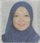
Pengarah, Pusat Sejahtera, Universiti Malaysia Pahang

Secara umum masyarakat selalu berpandangan murid perempuan lebih bijak berbanding lelaki. Hal ini disimpulkan berdasarkan kepada laporan kemasukan ke institut pengajian tinggi yang mana pelajar perempuan lebih ramai.