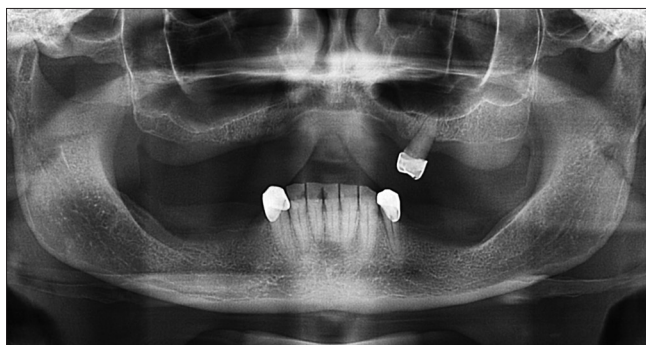
2. ábra: Az OPT felvétel mutatja a felső őrlefog supra-erupciós helyzetét, valamint a frontrégió kraniálisan ív alakú csontihiányát és a tuberek hipertrófiáját.

A megfigyelt elváltozások kialakulását többféleképpen magyarázták. Len Tolstunov elmélete szerint az őrlefogok hiánya a disztális régióban hipofunkciót eredményez, ennek következtében a hatékony rágás érdekében a rágási funkció a frontális területre tevődik át és a mandibula elülső területén a csontállomány vertikális irányban növekszik [27]. A meglévő, esetleg elongálódott alsó metszők folyamatos nyomást gyakorolnak a felső teljes protézisre a maxilla elülső, fogak által alá nem támasztott területén. Ez a folyamatos lokális terhelés okozza a csontlebonthatást a maxilla elülső területén [10, 27].