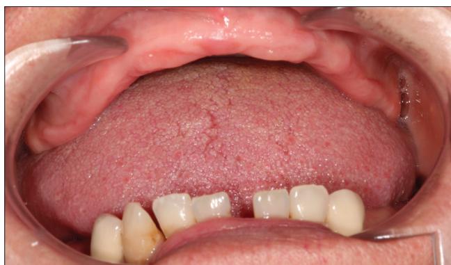
4. ábra: A kombinációs szindrómára jellemző fogazati státusz: a fogatlan maxillával szemben a mandibula frontfogai megtartottak.

megjelenése óta. A korábbi és az új OPT felvételén a maxilla front régiójának, a mandibula disztális régiójának csontvesztése jól látható volt, azonban a tuberek hipertrófiája nem volt kifejezett, az alsó frontfogak nem elongálódtak. A szájvizsgálat igazolta a felső front régió csontiányát, a tuber hipertrófiát, valamint a mandibulában a disztális gerinc kifejezett sorvadását. A páciens emlékezete szerint 6 éve viselte a felső teljes és az alsó részleges kivehető fogpótlást.