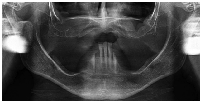
1. ábra: A kombinációs szindróma típusos esete az OPT felvételen. A maxilla frontrégiójának kraniálisan ív alakú csonthiánya, a tuberek hipertrófiája, a mandibula frontfogainak extrúziója, valamint a disztális régió csonthiánya látható.

további hat tünetet társítottak a már leírtakhoz: (1) harapási magasság csökkenése, (2) az okklúziós sík diszkrpanciája, (3) a mandibula relatív propulziója, (4) a kivehető pótlás nem megfelelő illeszkedése, (5) granuloma fissuratum és (6) parodontális változások [21] (1. ábra).