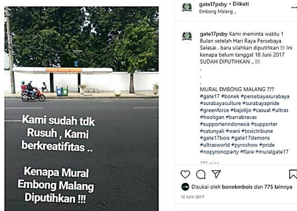
Gambar 12. Ekspresi kemarahan Bonek di Instagram

Pihak yang biasanya melakukan pemutihan tembok setelah dimural adalah pemilik tembok itu sendiri (karena alasan tidak menerima permohonan ijin membuat mural di propertinya) atau Satuan Polisi Pamong Praja (karena alasan penertiban). Pada peristiwa pemutihan tembok itu, pemilik tembok merasa tidak dimintakan ijin dari Gate17. Sebelum tembok