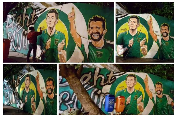
Gambar 6. Mural di Jl. Darmo Kali

Visual mural berikutnya adalah mural yang dibuat di kawasan Jl. Genteng Kali sebelah jembatan menuju kawasan Undaan, Surabaya. Berada di tengah kota yang terhubung dengan gedung bersejarah bernama Siola serta akses menuju TP maupun ke kawasan kota lama, Undaan.