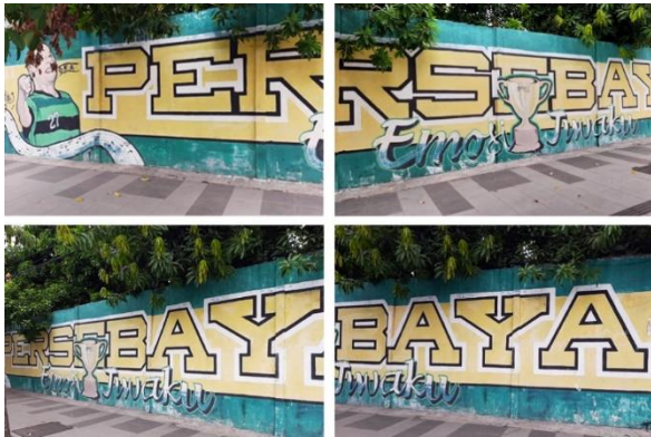
Gambar 5. Mural di Jl. A. Yani (2021)

Berikut ini visual mural yang dibuat oleh Gate17 serta bagaimana interpretasi komposisi yang terbentuk dari mural yang dibuat. Interpretasi komposisi digunakan untuk melihat gambar “apa adanya” dan memahami signifikansinya dalam the site of an image itself (Rose, 2001: 34).