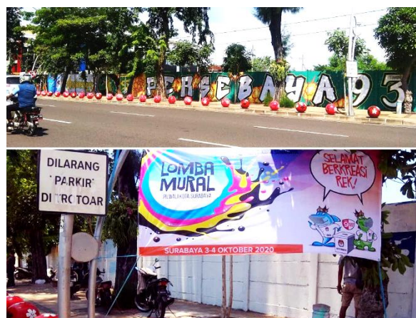
Gambar 13. Mural yang diputihkan di Jl. Rajawali.

Kejadian yang sama terulang kembali di bulan Oktober 2020. Mural di Jl. Rajawali yang dibuat Gate17 dalam rangka ulang tahun Persebaya ke-93 juga diputihkan (Gambar 13). Pemutihan tembok ini dilakukan oleh pihak Komisi Pemilihan Umum (KPU) Kota Surabaya melalui KPU Kecamatan Krembangan berkaitan dengan penyelenggaraan lomba mural KPU menyambut Pemilihan Kepala Daerah (Pilkada) bulan Desember 2020. Tembok di kawasan Surabaya Utara ini adalah salah satu titik penyelenggaraan lomba.