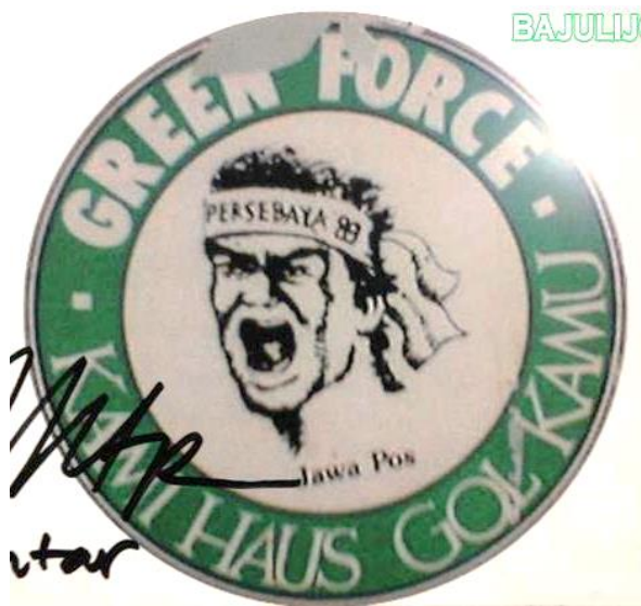
Gambar 1. Logo Bonek awal

Jawa Pos saat itu merupakan sosok di belakang layar untuk pengoordinasian suporter. Tercatat pula bagaimana identitas yang dipakai dalam kaus suporter Persebaya (dikenal sebagai wong mangap ) itu kini bahkan menjadi logo Bonek (Gambar 1 dan Gambar 2). Peristiwa tersebut kemudian diberitakan secara besar-besaran oleh media massa Jawa Pos sehingga memperoleh porsi perhatian yang luas dari masyarakat maupun pendukung klub lain. Bonek mulai identik dengan fan Persebaya Surabaya saat mulai sering dipakai nama tersebut di awal-awal tahun 2000-an.