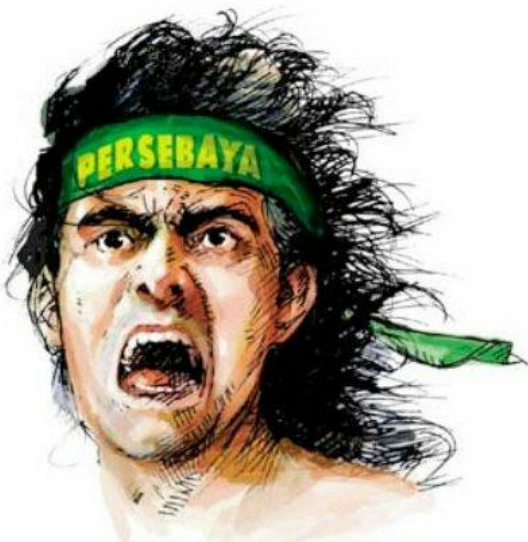
Gambar 2. Logo Bonek yang dipakai hingga kini

Bonek kemudian menjadi representasi Jawa Timur bukan hanya Surabaya. Bonek tersebar di mana-mana termasuk di kota-kota Jawa