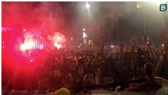
Gambar 10. Bonek menjemput bus yang mengangkut pemain Persebaya di Bundaran Waru

Jauh-jauh hari Bonek sudah memberi pernyataan, bahwa jangan sampai kalah menghadapi Arema. Namun rupanya Persebaya kalah. Meski begitu, pemain Persebaya menunjukkan semangat tempur yang tinggi di tengah intimidasi Aremania, suporter Arema. Penonton yang merangsek masuk lapangan saat istirahat babak pertama dengan merobek logo Persebaya serta memprovokasi pemain Persebaya yang sedang melakukan pemanasan, tetap membuat tidak gentar pemain Persebaya. Hal inilah yang kemudian mendapatkan kesan positif dari Bonek. Malam harinya saat pemain Persebaya kembali dari Malang, ribuan Bonek menjemput di Bundaran Waru, titik masuk kota Surabaya (Gambar 10). Mereka tetap mengapresiasi permainan pantang menyerah meskipun kalah.