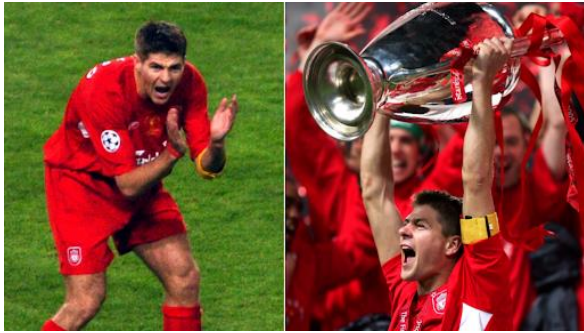
Gambar 9. Gestur Steven Gerrard saat bertepuk tangan memberi motivasi