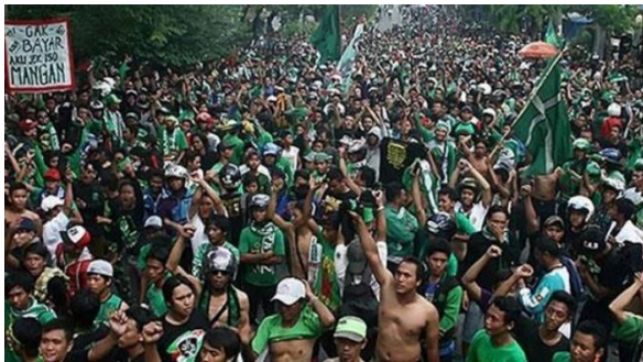
Gambar 8. Bonek saat aksi “Bela Persebaya” di Jakarta

Pada gambarnya di mural, Oka memakai jersey Persebaya bernomor 27. Angka 27 ini merujuk pada tahun kelahiran Persebaya, yaitu 1927. Nama “Persebaya 1927” inilah yang tak diakui oleh PSSI, namun dibela habis-habisan oleh Oka dan seluruh Bonek di segala penjuru tanah air. Tangan Oka yang terkepal menjadi isyarat mengenai perjuangan. Mengingatkan mengenai perjuangan dalam rangka mengembalikan Persebaya menjadi anggota PSSI dan berlaga di liga resmi, tangan yang terkepal itu juga suatu tanda untuk memotivasi Persebaya (Gambar 8).