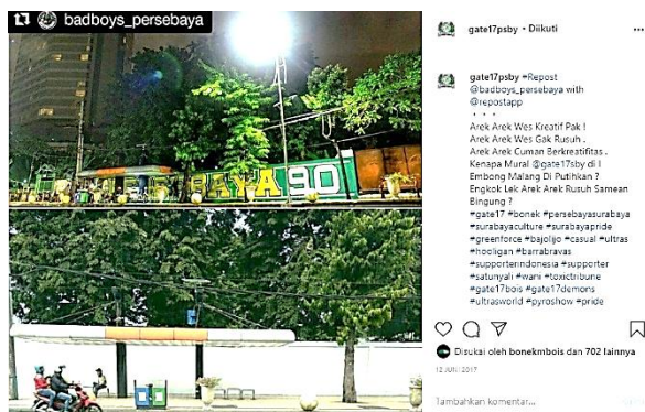
Gambar 11. Tembok diputihkan setelah baru saja dimural

Pada 12 Juni 2017 Bonek marah, karena mural di kawasan halte bus Jl. Embong Malang diputihkan (Gambar 11 dan Gambar 12). Mural yang dibuat oleh Gate17 itu adalah bagian dari perayaan ulang tahun Persebaya ke-90. Sontak saja Instagram milik Gate17 mengunggah foto pemutihan tembok yang baru dimural dan mendapat respon kemarahan dari Bonek.