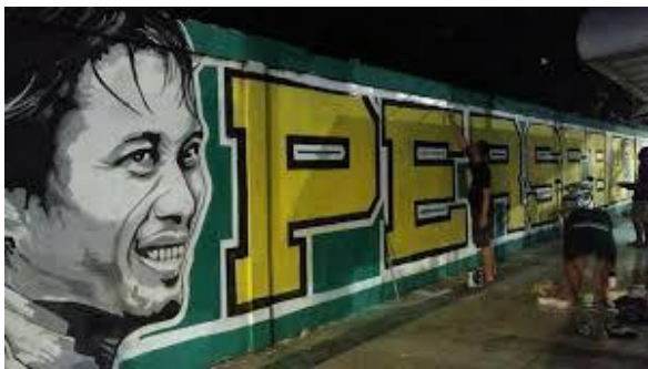
Gambar 3. Mural yang dikerjakan oleh Bonek

menjadi dukungan positif dan berbagai kata motivasi lain yang dipadukan dengan gambar pemain Persebaya maupun legenda yang dimiliki oleh Persebaya. Seni mural yang dibuat oleh Bonek menjadi tonggak penting terjadinya transformasi bentuk seni mural di Surabaya. Selama ini mural di Surabaya dikerjakan oleh seniman mural yang bergerak di bawah tanah yang tidak memiliki ijin dari otoritas kota maupun pemilik tembok. Seiring dengan kembalinya Persebaya bertanding, mural di Surabaya dikuasai oleh mural yang bertemakan Persebaya. Mural yang seperti ini sering disebut sebagai mural Bonek, karena dikerjakan oleh Bonek dan bertemakan tentang dukungan pada Persebaya. Tak jarang mural ini kemudian menjadi tempat ( spot ) dalam mendokumentasikan kehadiran seseorang di Surabaya melalui foto dan kemudian disebar-kan ke media sosial.