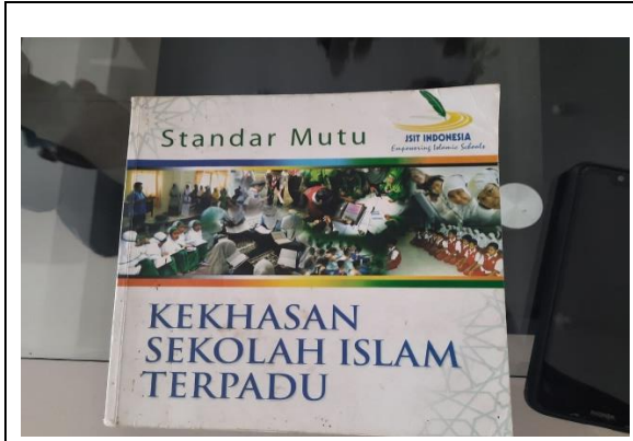
Buku Panduan JSIT