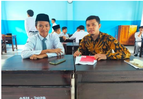
Wawancara Bersama salah satu Siswa