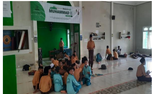
Kegiatan QTA (Quantum Tahfidz al-Qur'an)