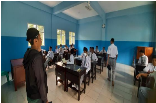
Pembelajaran Bahasa Arab di Kelas