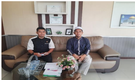
Wawancara Bersama Kepala Pondok