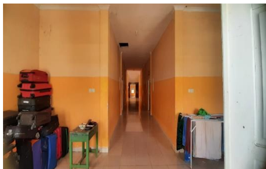
Salah satu Asrama Siswa