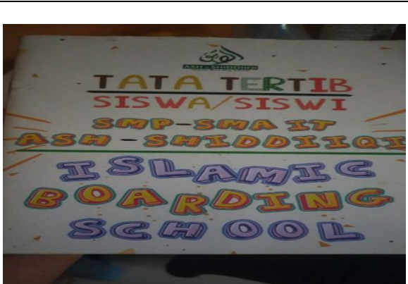
Buku Saku Tata Tertib Siswa