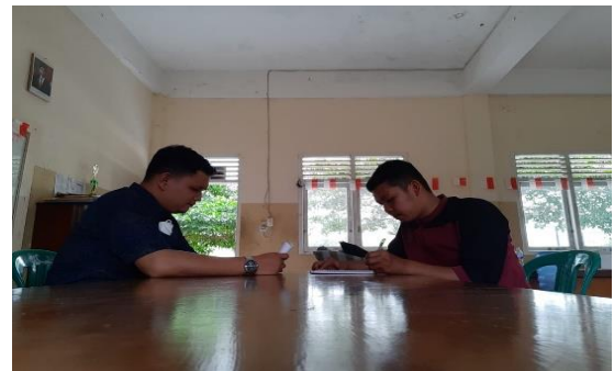
Wawancara Bersama Guru Bahasa Arab