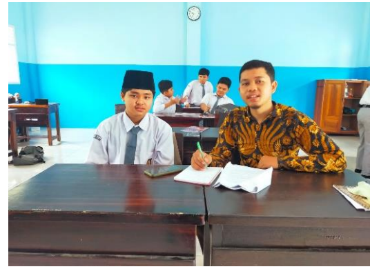
Wawancara bersama salah satu Siswa