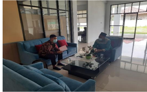
Wawancara Bersama Wakil Bidang Kurikulum