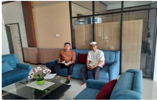
Wawancara Bersama Kepala Sekolah