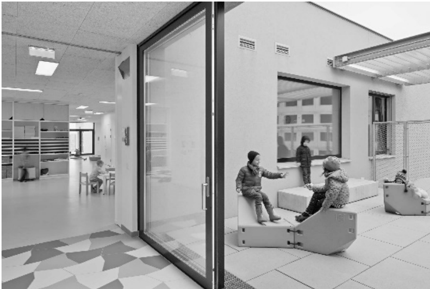
Abb. 3: Ausgang zur Freiklasse