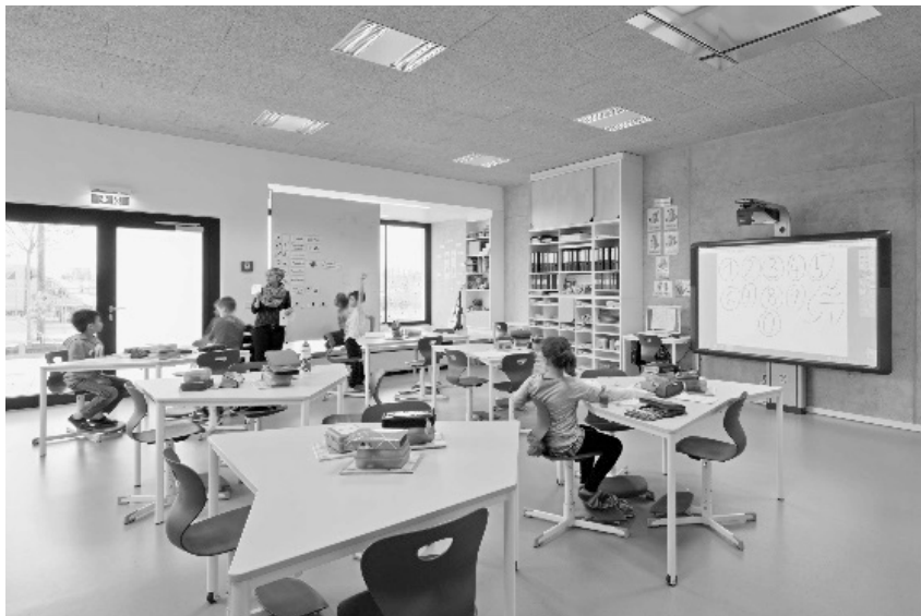
Abb. 4: Bildungsraum mit Blick zur Fensternische