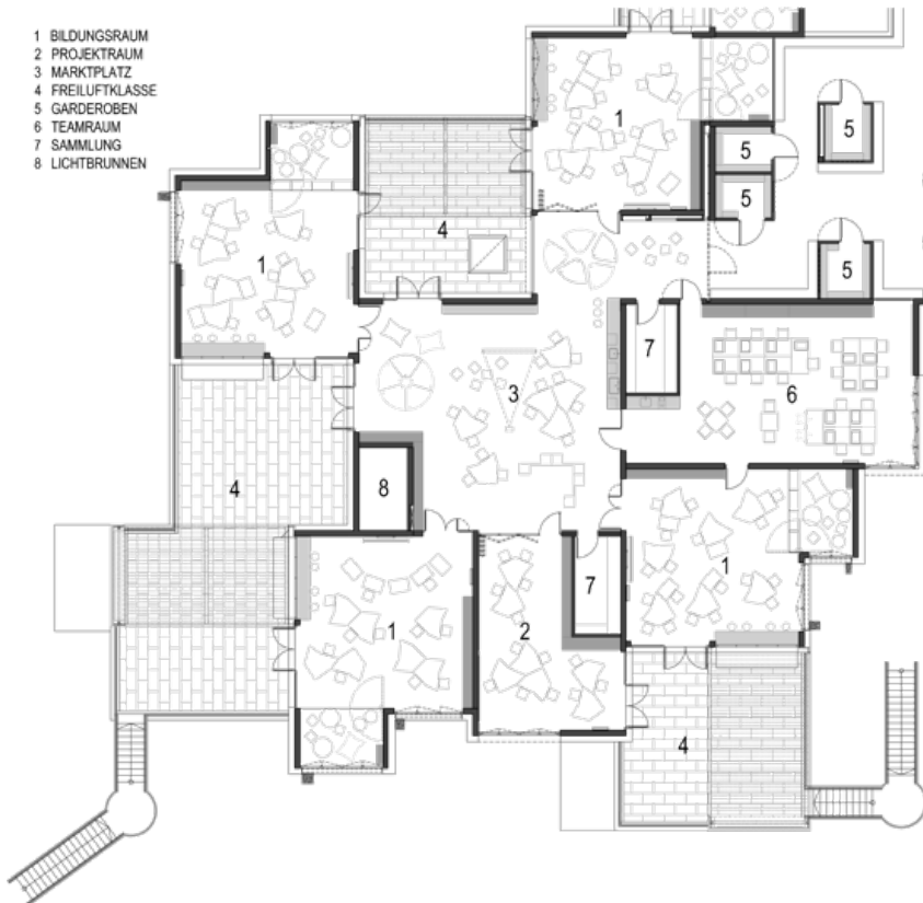
Abb. 1: Grundriss eines Clusters mit vier Bildungsräumen und gemeinsamer Mitte

Schule Sonnwendviertel Wien, PPAG Architekten, 2011–2014