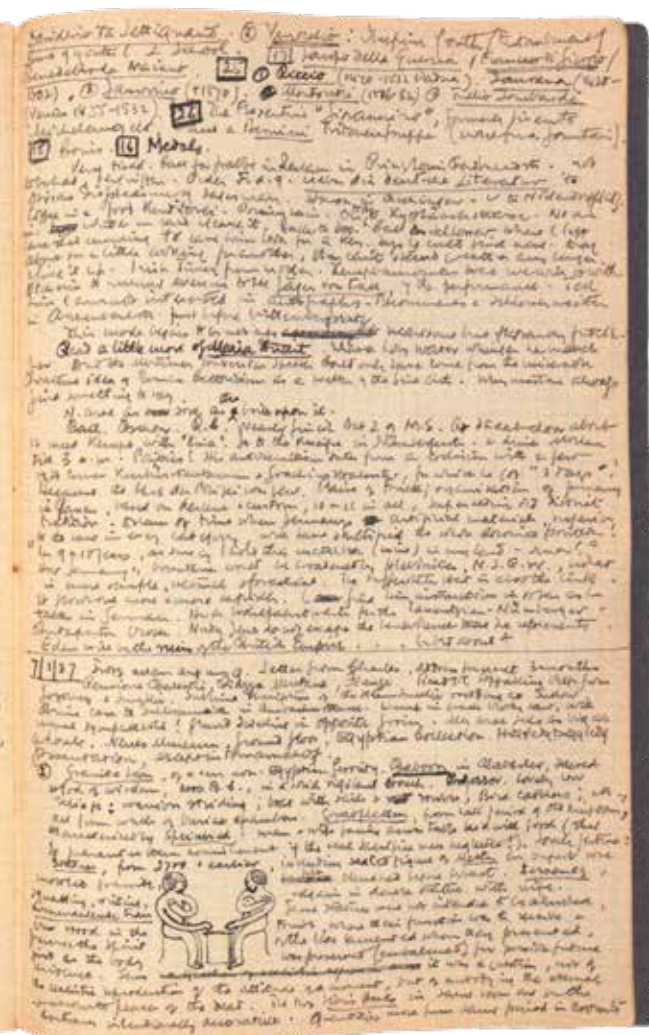
Eine Doppelseite des dritten der sechs German Diaries von Samuel Beckett mit Einträgen aus Berlin vom 6. und 7. Januar 1937.