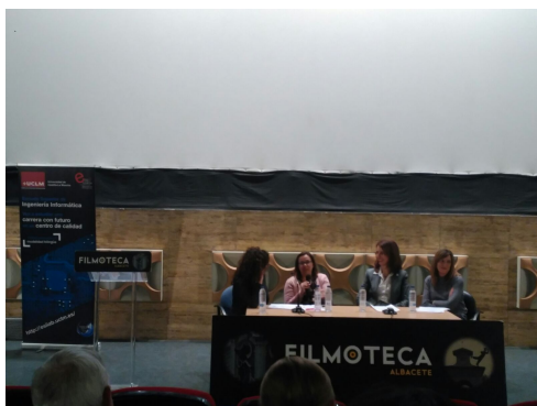
Figura 5: Mesa redonda Mujer e Informática en la Filmoteca de la ciudad

la competitividad a largo plazo en España. No podemos prescindir del potencial que ofrecen las mujeres aportando su visión. Según uno de los últimos informes de la consultora Randstad Research [12], se prevé que la digitalización genere 1.250.000 empleos en los próximos cinco años. Sin las mujeres, los equipos no tendrán la diversidad necesaria para garantizar el éxito de los productos, tal y como se comentaba en la Sección 1. Aún peor, ni siquiera tendrán la perspectiva de cubrir los puestos requeridos.