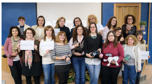
Figura 3: Científicas de nuestra Escuela con el 11 de Febrero