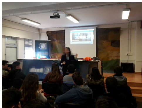
Figura 4: Momentos de las charlas en algunos de los IES visitados