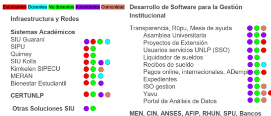
Fig. 3 – Ecosistema Tecnológico - Usuarios de la UNLP

A modo de resumen de las soluciones ofrecidas y para comprender mejor al ecosistema de soluciones, el siguiente cuadro de la figura 3, ilustra los distintos perfiles de los usuarios para los principales sistemas.