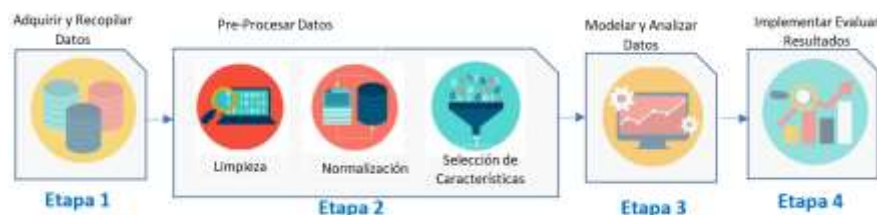
Fig 2.2: Etapas de Big Data

Lo primero a considerar en un ciclo de análisis de Big Data es “adquirir y recopilar los datos” definiendo cuáles datos serán de relevancia: Etapa 1.