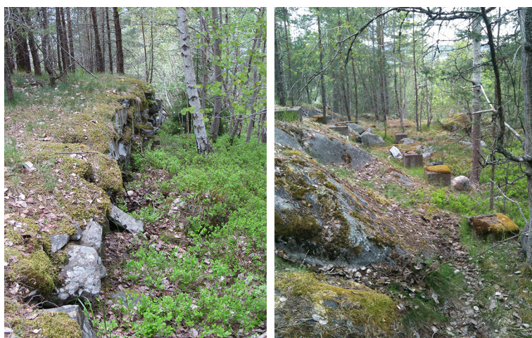
Figur 6. Tv. Stenpackningen som bildat landningsbacke samt th. betongfundament efter hopptornet vid Saltsjöbaden.

Ett mönster som tidigt anades i södra och mellersta Sverige var dock att ett flertal större anläggningar byggdes på landsorten och då främst vid orter med starka industriföretag. Relationen som etablerades mellan idrotten och näringslivet genom bygget av hoppbackar tycks vara särskilt accentuerad där. Ett representativt exempel finner vi någon mil nordväst om Finspång. Vid