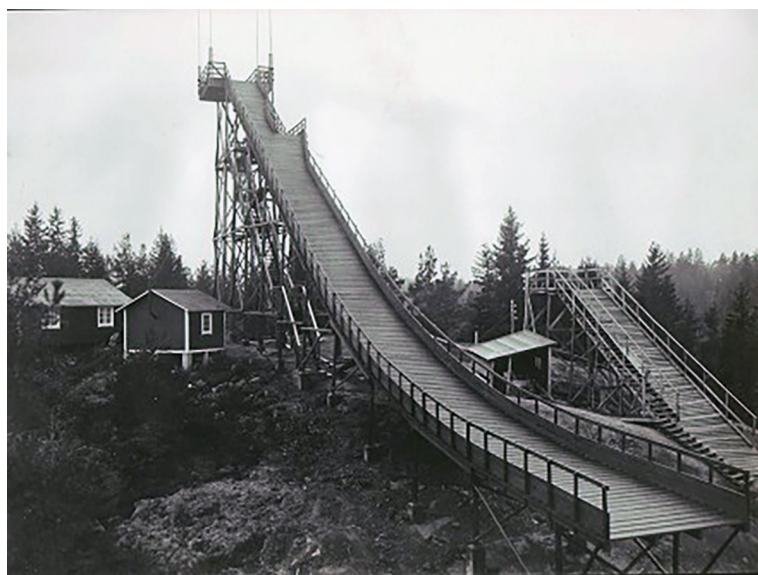
Figur 8. Det stora hopptornet i Borggård under dess glansdagar på 1930-talet.

Borggård är representativt för majoriteten av de hoppbackar som byggdes söder om Stockholm under första hälften av 1900-talet. Det rör sig ofta om anläggningar finansierade av industriföretag; stora hopptorn som med tiden förfaller, placerade på höjder i nära anslutning till mindre industriorter. Det