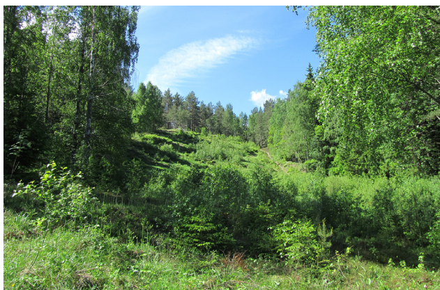
Figur 7. Svårupptäckta spår av hoppbacken vid Borggård. Spår efter röjning av vegetation visar var landningsbacken en gång var belägen.

den lilla bruksorten Borggård byggdes en stor backhoppningsanläggning i början av 1930-talet, bestående av ett större och ett mindre hoppstorn. Initiativet till bygget togs gemensamt av Östergötlands idrottsförbund och ett antal drivande, skidintresserade personer på industriföretaget STAL. Platsen som valdes var en höjd i nära anslutning till orten och idag finns få synliga tecken kvar. Landningsbacken kan ännu anas där träd fällts i en gata nerför höjden, i övrigt är spåren svårfunna (Fig. 7).