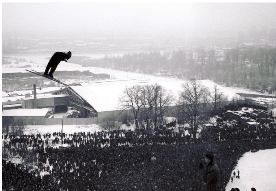
Figur 5. Fotografi från SM-tävlingar i Hammarbybacken på 1950-talet.

fragmentiserad, hopptornet är borta och det som återstår är fundamenten och den massiva stenpackning som bildat landningsbacken (Fig. 6). Den är gömd och bortglömd för den som inte söker eller känner till dess läge, men när den upptäcks så ger den ännu ett storslaget och imponerande intryck i egenskap av en lämning från det förflutna. Bragebacken är betydligt mer välbehållen, men har antagit formen av något övergivet och förstelnat.