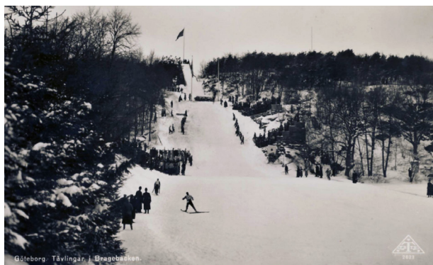
Figur 3. Vykort med fotografi från tävlingar vid Bragebacken någon gång under tidigt 1900-tal.

rades även med en rodelbana och fick epitetet ett ”svenskt Holmenkollen”. 31 Hoppenbackens storlek gjorde bygget omfattande och statlig nödhjälpsarbetskraft utnyttjades för färdigställande av den stora landningsbacken. 32 Lösningen blev under de kommande decennierna vanlig för hoppbacksbyggen och utgjorde en tidig koppling mellan backhoppningsanläggningarna och ett större samhällssammanhang.