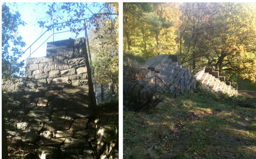
Figur 4. Tv. Bragebackens murade hopptorn, idag delvis täckt av vegetation. Th. Läktare i sten.

En effekt av storleken på de första backarna, som kom att bli något av ett mönster för kommande decenniers byggen, var att de tämligen snabbt krävde upprustningsarbeten. Att underhålla dem var arbetsamt och efter ett tiotal år behövdes ofta omfattande insatser för att hålla anläggningarna aktiva. Likt andra monumentala konstruktioner, började förfallet av hopporna nästan omedelbart och måste motverkas kontinuerligt. Det konstanta behovet av insatser gjorde fortsatta samarbeten mellan klubbar, näringsliv och samhälle nödvändiga. Idag ligger både backen vid Saltsjöbaden och Bragebacken i Göteborg i ruiner och har karaktären av minnen från ett avlägset förflutet. De påminner om förhistoriska lämningar på olika sätt. Saltsjöbaden är dold och