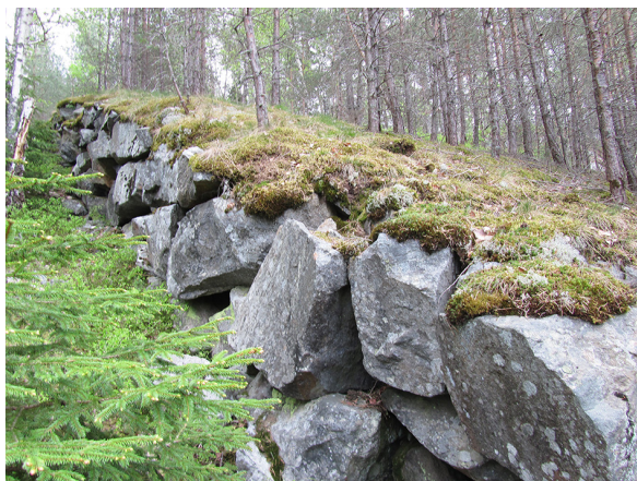
Figur 1. Den kallmurade stenpackningen som bildat landningsbacke vid Saltsjöbadens hoppanläggning.

När resterna av backhoppning återfinns idag, är deras tillstånd långt ifrån hur anläggningarna tedde sig under sin storhetstid. Att uppleva backhoppningens platser innebär mötet med ett materialiserat förflutet, ett undanskymt materiellt minne som i sig självt kontrasterar fundamentalt mot de monumentala skidsportarenor som en gång stod på dessa platser. Mötet väcker en rad frågor. För det första, varför finns det så många platser med rester av övergivna hopptorn, framförallt i södra Sverige? Vad kan dessa undanskymda lämningar lära oss om det förflutna? Finns en alternativ historia om det moderna industrialiserade 1900-tals Sverige inneboende i spåren efter backhoppningssporten och hur ser den ut? Dessa frågor har legat till grund