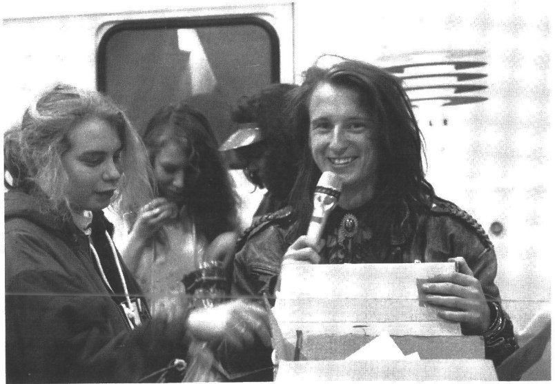
Radiomafian Next Step -ohjelma (1991).

15 Yleisradio ja viestinnän muutos. Suunnittelu- ja koulutustoiminta. Helsinki: Oy Yleisradio Ab 1986, 47, 38, 48.