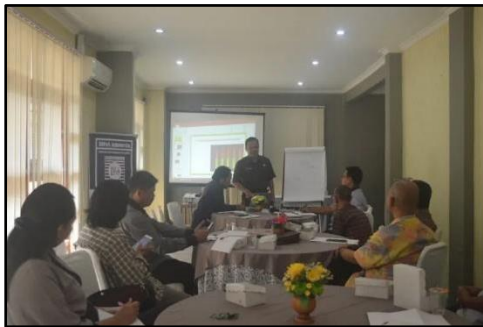
Gambar 3 : Diskusi Reboan Dialog Ketenagakerjaan Sumber: IDFoS Indonesia

Pemilihan isu dilakukan dengan mengumpulkan data dan informasi aktual di masyarakat, dari berbagai isu yang muncul kemudian dilakukan sejumlah analisa untuk menentukan isu strategis apakah yang akan diadvokasikan. IDFoS Indonesia melakukan pemilihan isu strategis berdasarkan pada temuan riset ketenagakerjaan yang dilakukan, kemudian hasil dari riset tersebut didiskusikan bersama dengan pihak pemerintah, akademisi dan LSM lainnya dalam dua kali FGD program Diskusi Reboan. Hasil dari riset ketenagakerjaan dan kesimpulan dari diskusi tersebut menjadi dasar bagi IDFoS Indonesia dalam menetapkan isu strategis yang diangkat, diantaranya mengenai 1) kualitas angkatan kerja, 2) pengelolaan database ketenagakerjaan, 3) kerja layak, 4) perluasan lapangan kerja, dan 5) pelatihan ketenagakerjaan dan kewirausahaan.