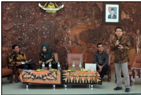
Gambar 5 : Seminar Ketenagakerjaan

Untuk menginformasikan mengenai kondisi dunia kerja kepada generasi muda pada bulan Oktober 2018 IDFoS Indonesia mengadakan seminar ketenagakerjaan dengan tema “Kuliah Umum Generasi Z dan Revolusi Industri 4.0”. Dalam acara tersebut para peserta mendapat penjelasan mengenai kondisi kerja yang saat ini semakin berbasis teknologi, generasi z memiliki peran penting karena mereka dekat dan hidup di era teknologi tersebut, sehingga perlu adanya upaya mengarahkan generasi muda menuju revolusi industri 4.0. Dijelaskan juga mengenai kondisi ketenagakerjaan di Indonesia yang menurun secara kualitas, oleh karena itu diperlukan pembangunan SDM sebagai investasi menuju negara maju. Kemudian di sela-sela acara diselingi juga dengan penyerahan Policy paper yang telah disusun kepada Wakil Bupati Kabupaten Bojonegoro dan Kementrian Tenaga Kerja dan Transmigrasi agar menjadi pertimbangan dalam membuat kebijakan ketenagakerjaan di Kabupaten Bojonegoro.