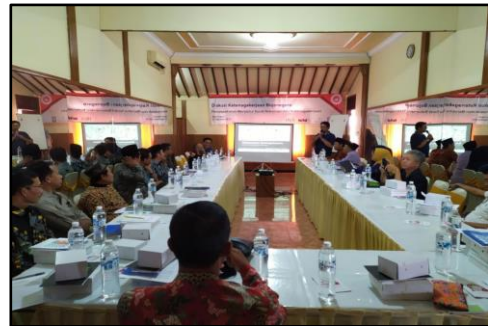
Gambar 6 : Rekomendasi Bersama Koalisi Ketenagakerjaan Bojonegoro

Dalam membangun basis gerakan, IDFoS Indonesia membentuk suatu Koalisi Ketenagakerjaan Bojonegoro, dimana pihak-pihak yang bergabung berasal dari LSM, Ormas serta pondok-pondok pesantren yang memberi dukungan terhadap advokasi kebijakan ketenagakerjaan yang dilakukan. Kemudian pada Agustus 2019 IDFoS Indonesia mengadakan Diskusi Penyepakatan dan Penandatanganan Bersama Rekomendasi Kebijakan Ketenagakerjaan Bojonegoro.