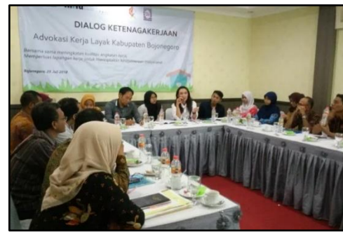
Gambar 4 : Diskusi Pemaparan Policy Paper

Strategi yang juga diambil oleh IDFoS Indonesia adalah menggandeng ormas yang memiliki massa besar seperti NU, Muhammadiyah, PD Aisyiyah dan pondok pesantren sehingga advokasi yang dilakukan menjadi nilai tambah lebih kepada pemerintah.