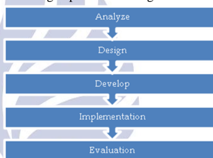
Gambar 1. Tahap ADDIE (Sumber: Danks, 2011)

Penelitian pengembangan Alat Peraga yang mengacu pada model ADDIE ( Analysis, Design, Development, Implementation, dan Evaluation ) dengan rancangan penelitian sebagai berikut.