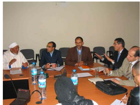
Figures 7 et 8. Liste des questions énumérées lors du débriefing et réunion après la session de JdR confrontant les agriculteurs aux autorités compétentes.

Utilisé comme outil de facilitation du processus, le JdR Tadla n'a pas pour vocation première de produire de la connaissance scientifique. Néanmoins, certaines informations importantes sont venues compléter les informations issues des enquêtes préliminaires.