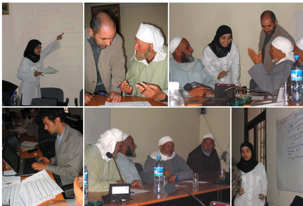
Figure 5. Différentes étapes du JdR Tadla (respectivement de gauche à droite et de haut en bas) : introduction de l'exercice de simulation, définition des attentes individuelles, discussion collective avec l'ingénieur conseil autour des choix d'aménagement, synthèse des choix individuels et simulation des coûts, discussion collective autour de décisions problématiques et liste des questions importantes durant le débriefing.

Outre les animateurs des sessions, dont l'un d'eux endossant le rôle du consultant, deux gestionnaires de l'ORMVA Tadla étaient présents. Ils pouvaient être consultés par les agriculteurs et apporter leur point de vue, mais avaient comme contrainte formelle de ne pas influencer le choix des agriculteurs dans la construction de leur projet virtuel. Les sessions se sont toutes deux déroulées sur une journée à la Chambre d'agriculture du Tadla, lieu communément considéré comme neutre. La première session a été achevée intégralement, la matinée étant consacrée à l'exercice de simulation et l'après-midi au débriefing et à l'évaluation. En revanche, la seconde session a dû se dérouler sur une matinée uniquement, ce qui empêcha de conduire le débriefing et l'évaluation dans leur intégralité. Les deux sessions furent bien accueillies et appréciées par les participants (figure 5).