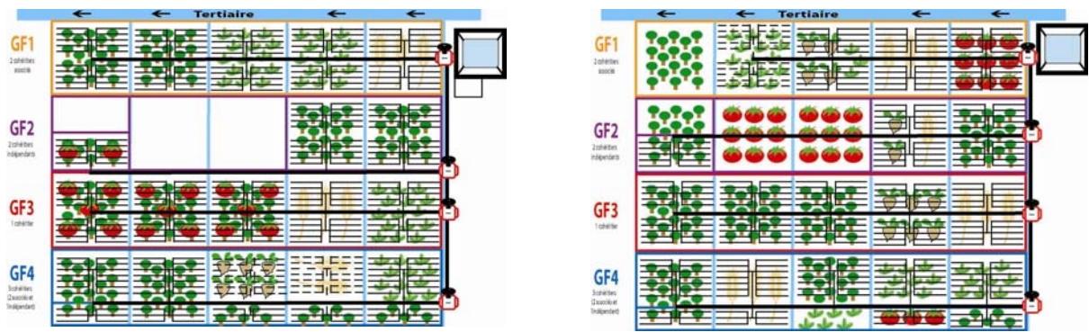
Figure 6. PCI virtuels avec les cultures projetées et les aménagements (équipement à la parcelle, bassin, pompage, canalisation, compteurs et vannes) respectivement obtenus (depuis la gauche) lors de la première et de la seconde session de JdR.

Dans le but d'identifier les informations manquantes, une liste de questions fut dressée durant le débriefing (figure 7). En termes de besoins, les principales questions exprimées sont relatives aux aspects financiers, à la structure de gestion et son organisation interne, enfin à l'accompagnement du projet et la formation aux nouvelles techniques d'irrigation. Ces questions furent directement adressées par les agriculteurs aux autorités compétentes (ABH, ORMVAT, ADS) lors de deux réunions qui ont suivi les sessions et organisées à cet effet (figure 8).