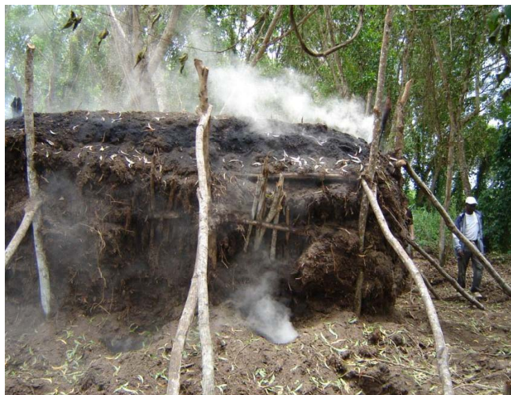
Photo 7 : Les techniques de carbonisation sont de mieux en mieux maîtrisées par les agrisylviculteurs de Mampu

Les techniques de carbonisation sont de mieux en mieux maîtrisées par les agrisylviculteurs de Mampu. Une meule de 30 stères (4 x 3 x 2,5 m), soit environ 24 T de bois sec à l'air, donne en moyenne 80 à 90 sacs de 60 kg, soit 5,1 T, ce qui correspond à un rendement légèrement supérieur à 20% du poids sec à l'air ( Photo 7 ). Ce rendement est satisfaisant par rapport aux rendements maximaux que l'on trouve dans la littérature pour la carbonisation en meule (23 % d'après Briane et al, 1985) et les accidents (incendie de la meule, brûlures des charbonniers) se font heureusement de plus en plus rares.