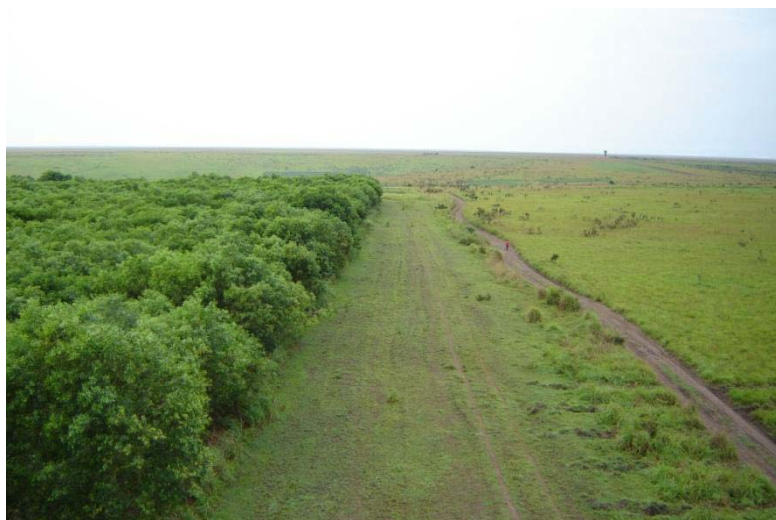
Photo 4 : Entre 1987 et 1993, la société HVA a boisé environ 8 000 ha de savane dégradée

Entre 1987 et 1993, la société HVA a boisé 7.262 ha de savane dégradée ( Photo 4 ), principalement à l'aide d' Acacia auriculiformis (plus de 95% de la surface plantée).