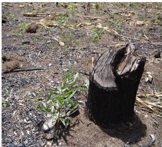
Photo 5 : Acacia auriculiformis ne rejette pas de souche, après la coupe. Le passage superficiel du feu lève la dormance des graines d'acacia qui germent en grand nombre

C'est bien le cas à Mampu où, en théorie, chaque année, l'« agrisyviculteur » (nom que nous donnons à l'agriculteur pratiquant l'agroforesterie, pour le distinguer de l'agroforestier, nom plus utilisé pour les scientifiques) exploite une parcelle d'environ deux hectares, transforme le bois en charbon, brûle les résidus en début de pluie et met en place sa culture mélangée de maïs et de manioc. Il faut noter que A. auriculiformis ne rejette pas de souche, après la coupe. Le passage superficiel du feu lève la dormance des graines d'acacia qui germent en grand nombre (Photo 5). Lors des sarclages de ses cultures, l'agrisylviculteur les préserve sur les lignes qui joignent les souches mortes. Au besoin, il peut regarnir les zones où les semis sont trop rares. 4 mois après le feu, à la récolte du maïs, les acacias ont environ 1m de haut ; 18 mois après le feu, à la récolte du manioc, les acacias ont environ 3 m de hauteur (Photo 6).