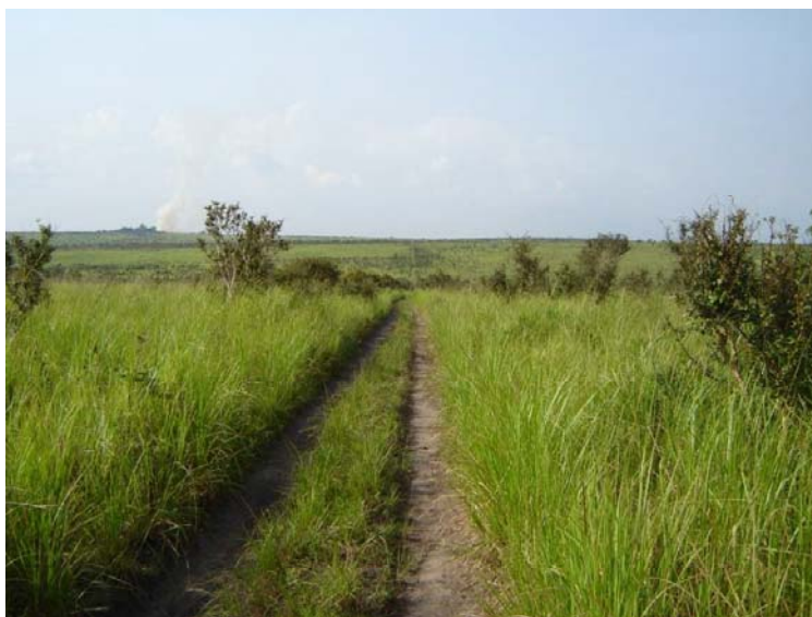
Photo 2 : La savane arbustive est la formation naturelle dominante des plateaux Batéké

Administrativement parlant, la zone du Plateau Batéké est située dans la Province de Kinshasa. Historiquement, cette zone était peu densément peuplée par l'ethnie Téké : environ trois habitants au km 2 . L'autorité traditionnelle est exercée par les chefs coutumiers dont le rôle, en droit moderne, n'est pas clairement précisé en matières judiciaire et foncière. L'ordre public, l'hygiène, la santé, l'éducation, les communications sont du ressort des autorités territoriales.