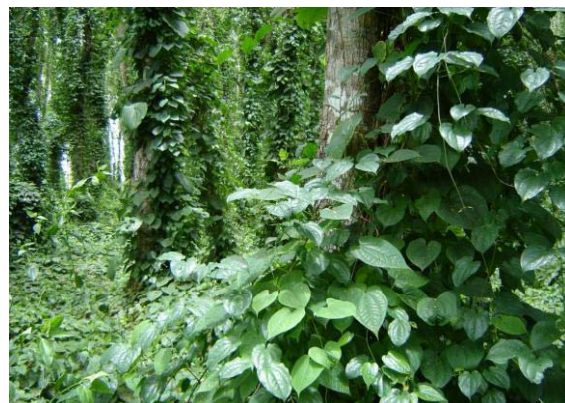
Photo 9 : De nombreuses espèces végétales et animales qui n'étaient présentes que dans les îlots forestiers se retrouvent aujourd'hui dans la majorité des parcelles. Ceci est le cas, par exemple pour les ignames sauvages

Bien qu'il n'y ait pas eu de mesure scientifique de l'évolution de la biodiversité, la perception des agrisylviculteurs et de la plupart des visiteurs est qu'un écosystème forestier se reconstitue assez rapidement sur le périmètre du projet, en lieu et place de l'ancien écosystème de savane. De nombreuses espèces végétales et animales qui n'étaient présentes que dans les îlots forestiers se retrouvent aujourd'hui dans la majorité des parcelles. Ceci est le cas, par exemple pour les ignames sauvages (Photo 9) et pour de nombreuses autres lianes et espèces arborées pionnières comme Anthocleista schweinfurthii . Ceci incite les habitants à y développer des pratiques de cueillette (jeunes pousses (Photo 10), champignons, chenilles, tubercules, etc.) et de chasse (rongeurs, reptiles, céphalophes, etc.), autrefois limitées aux zones forestières.