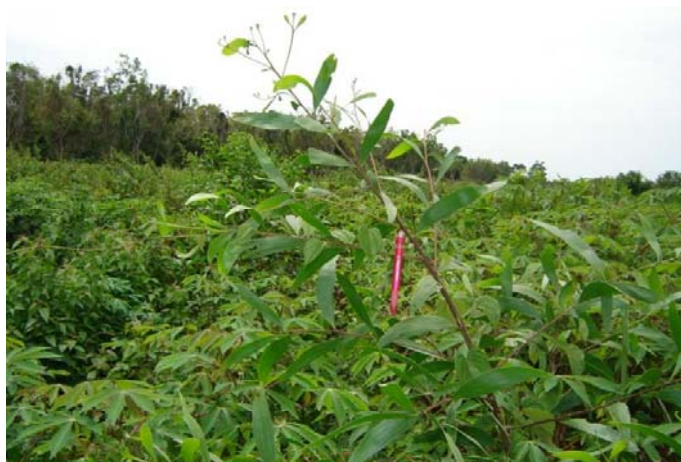
Photo 6 : 18 mois après le feu, à la récolte du manioc, les acacias ont environ 3 m de hauteur