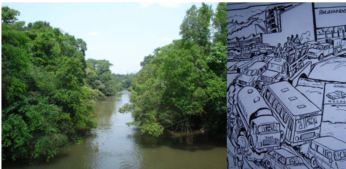
Photo 1 : la RD Congo abrite un immense massif forestier mais sa capitale, Kinshasa, souffre d'une pénurie de bois de feu

Le nord de la République Démocratique du Congo pays est un des plus grands massifs de forêt équatoriale au monde (Photo 1). Le sud et le centre, en grande partie couverts par des savanes arborées, forment un plateau. La forêt du Mayombe, au sud-ouest, et la forêt claire de type Miombo, au sud-est, forment des massifs forestiers parmi les plus soumis à la pression anthropique.