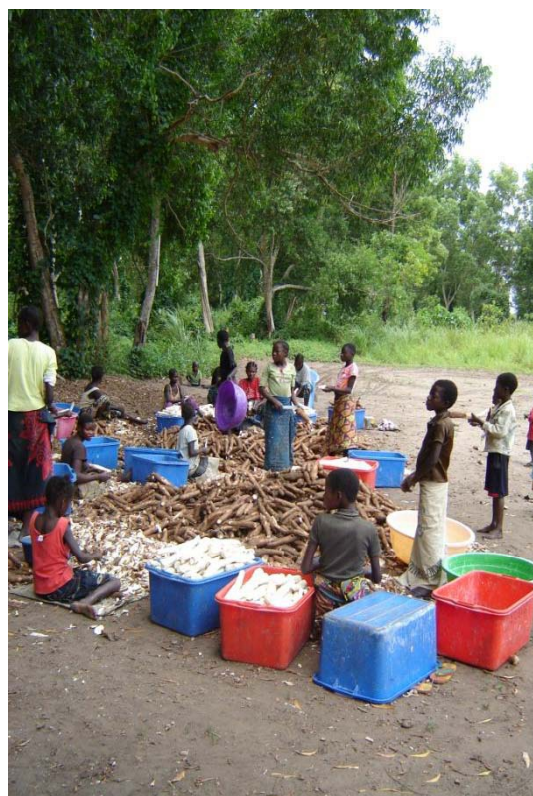
Photo 8 : La production totale du périmètre, pour 320 exploitations de 25 ha, peut ainsi être estimée à environ 10 000 T/an de manioc et 750 T/an de maïs