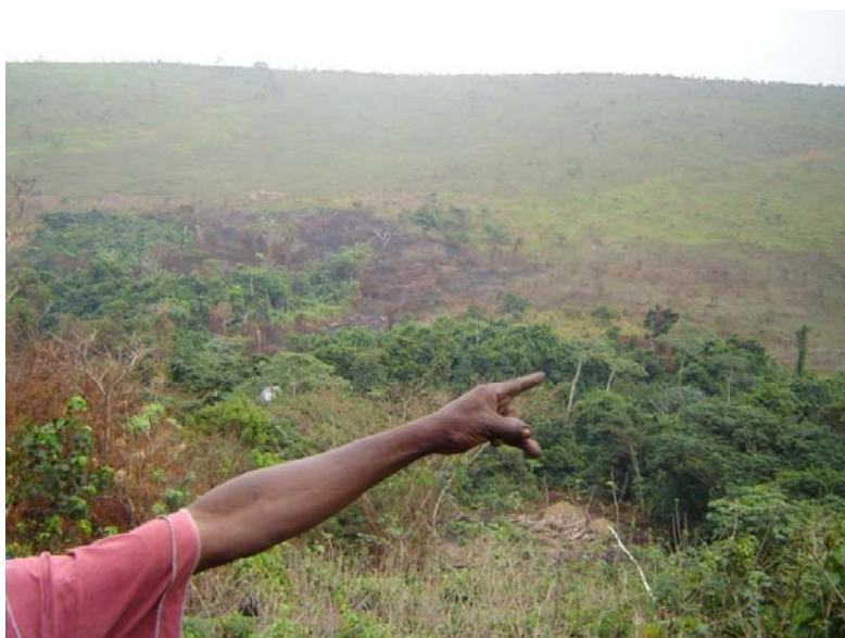
Photo 3 : Les flancs des vallées du plateau Batéké portaient autrefois des forêts denses aujourd'hui plus ou moins dégradées par l'agriculture itinérante

Les activités économiques sur le Plateau sont essentiellement orientées vers l'agriculture itinérante. L'infrastructure routière y est peu développée.