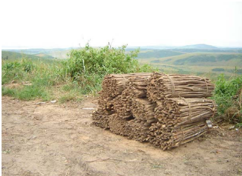
Photo 11 : La sciure et les dosses de bois de scierie, les fagots de perchettes de bois provenant de la périphérie de la ville

provenant de la périphérie de la ville (Photo 11) et divers déchets sont aussi récupérés. Plusieurs boulangers se fournissent directement en rondins de bois par leur propre circuit. Il est donc probable que Mampu assure plutôt de l'ordre de 5 à 10 % de la couverture des besoins en charbon de bois de la ville, ce qui est remarquable, si on considère que ses 100 km 2 ne couvrent que 0,3 % du demi-cercle de 150 km de rayon, qui constitue le bassin d'approvisionnement de Kinshasa.