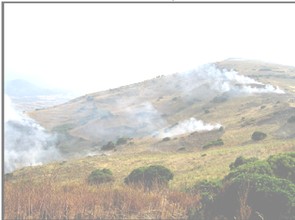
Photo 2 : Région de Corte (Haute Corse), parcours non incinéré depuis plus de 5 ans envahis par les cistes en premier plan, auréoles de cultures en bas fond