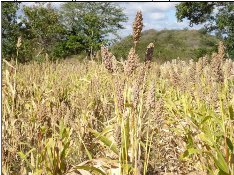
Photo 3. Parcelle de sélection des lignées PCR-2 sous gestion de rebrote à Unile (parcelle de Hugo Francisco Guillén) en postrera 2007.

Pour l'objectif de sélection correspondant au système de culture rebrote , les travaux de création de lignées, démarrés plus récemment, sont toujours en cours. Toutefois, l'évaluation préliminaire des lignées S_2 et S_3 durant le processus de création a montré qu'il était possible d'obtenir des lignées ayant des cycles bien calés par rapport aux deux saisons de culture, un type de plante adaptée à la culture associée, une bonne vigueur de rebrote , une productivité en grain supérieure à la meilleure variété témoin sur l'ensemble des deux cycles et des caractéristiques de type de plante et de grain appréciées par les agriculteurs (photo 3). La pratique du rebrote étant toutefois connue pour ses effets négatifs sur la fertilité des sols, ce travail de sélection est accompagné depuis 2007 par la conduite d'essais agronomiques visant à définir les meilleures pratiques combinant association sorgho-légumineuse (haricot commun, niébé et haricot mungo ) et amendements organiques pour maintenir la productivité du système.