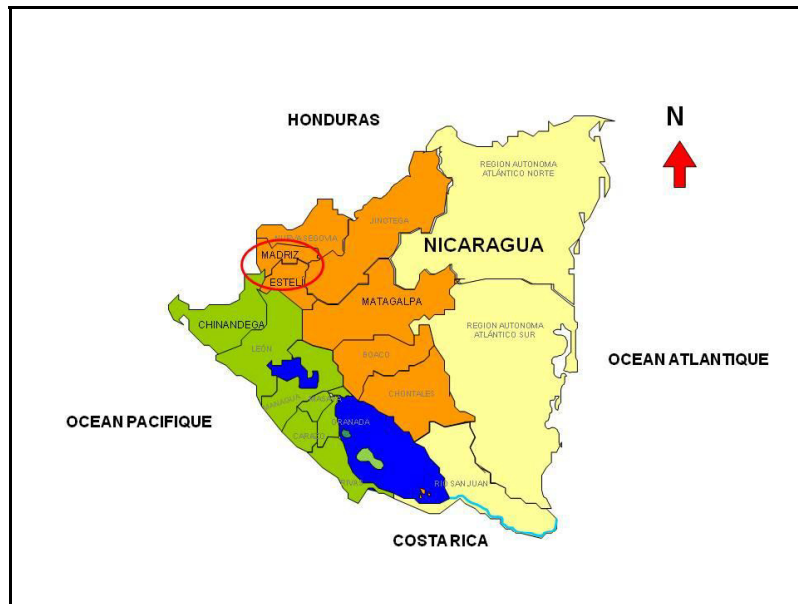
Carte 1. Zone d'intervention du projet sélection participative sorgho au Nicaragua

Dans cette zone, un premier diagnostic approfondi a fait ressortir une demande des agriculteurs pour l'amélioration de trois types de sorgho cultivés localement, les sorghos millón 1 , tortillero 2 et escoba 3 (Martínez Sanchez, 2002; Trouche et al., 2006). Le programme de recherche a ainsi commencé à travailler sur ces trois types, en utilisant l'approche de sélection variétale participative (en anglais Participatory Variety Selection-PVS), et en ayant recours à une large diversité de variétés et lignées existantes, notamment parmi celles développées par le Cirad et ses partenaires en Afrique de l'Ouest pour des écosystèmes similaires (climat semi-aride et sols de faible fertilité). Chemin faisant, les critères de sélection pour chaque type de sorgho ont pu être définis sur la base i) des contraintes et objectifs de production des systèmes de culture cible, ii) des observations des agriculteurs par rapport aux nouveaux types de plante évalués sur le terrain et iii) de la confrontation entre les phénotypes préférés et leurs performances agronomiques mesurées in situ . Dans ce cas, trois saisons de culture ont été nécessaires pour co-définir précisément les idéotypes variétaux. Cette approche PVS a fourni des résultats probants; elle a permis d'identifier et diffuser plusieurs variétés des types millón et tortillero, dont une, Blanco Tortillero, a été officiellement inscrite au catalogue variétal national (Trouche et al., 2008).